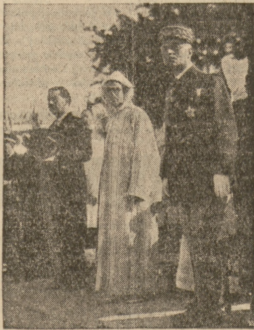
Na zdjęciu — o dlewej ku prawej — francuski minister Lotnictwa Guy la Chambre, Sultan Maroka i generalny rezydent gen. Nogues, podczas uroczystości odsłonięcia pomnika Marszałka Lyauteya w Casablance.