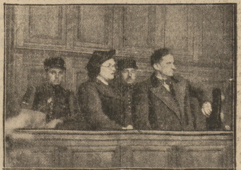
Krewni Grynshpana zabójcy v. Ratha, zamieszkałi w Paryżu, stanęli przed sądem za ukrywanie Grynshpana. Zostali oni skazani na grzywny.