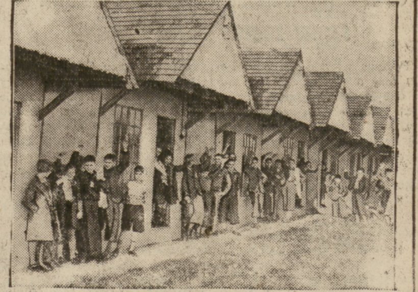
W Anglii w Dovercourt Bay założono obozy dla 5000 dzieci żydowskich sprowadzonych z Niemiec. Dzieci te zostaną wysłane do Dominów i kolonii angielskich.