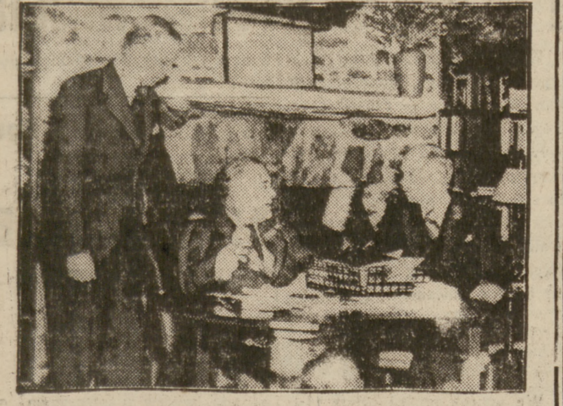
Ambasadorzy amerykańscy w Berlinie i Rzymie składają Prezydentowi Rooseveltowi bezpośredni raport o sytuacji w „Trzeciej” Rzeszy i faszystowskich Włoszech.