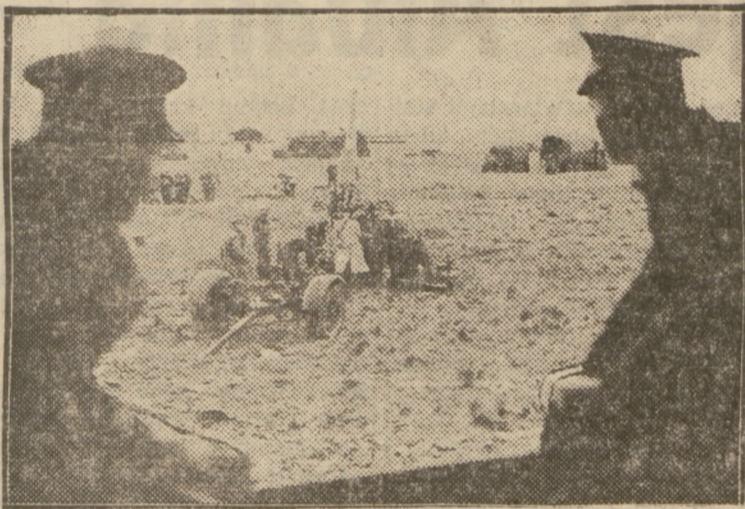
OBRAZEK Z ANGIELSKICH MANEWRÓW.