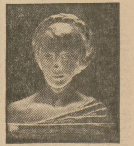
G. HIESZ: Głowa dziewczyny