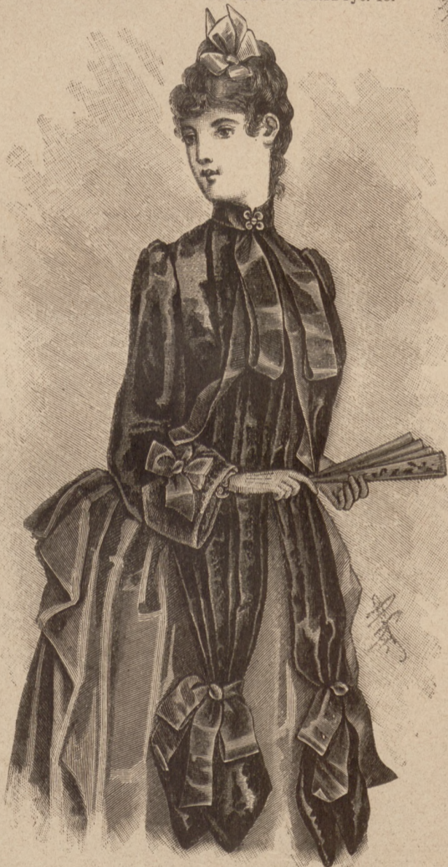
N. 5. Okrycie balowe. Patrz ryc. 8 i 14 w N. 48.

ca 19 cent. długości a 144 szerokości, ułożona była w 6 cent. szerokie kontrafałdy, z 5 cent. szerokimi odstępami, naszytymi szafirowym aksamitem. Aksamitna berta stanika wązko zachodząca na krótkie bufowane rękawki, wycięta jest z przodu iztyłu, w dwa zęby 7 cent. głębokie.