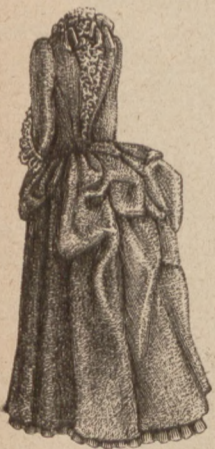
N. 16. Pleczy do r. 37.

żelaza, lub z drzewa robotą snycerską. Model pokrowca składającego się z pięciu części oddzielnych, zeszytych z sobą, przedstawia ryc. 44. Część tylna jest gładka aksa-