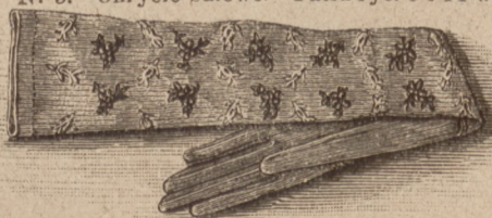
N. 6. Rękawiczka haftowana. Patrz ryc. 7—8.