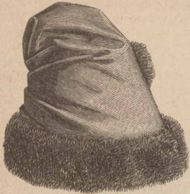
N. 11. Berecik sukienny. Patrz ryc. 1.

mitna a część zwierzchnia i części boczne są haftowane na aksamicie jedwabiami, cienką sznelą i nitką złotą. Trochę więcej jak połowę deseni na część zwierzchnią i frontową dajemy na ryc. 18 w N. 49, a desień na mniejsze boczne strony na dodatku z krojami do N. 46 i 47 Tyg. mód, fig. 118. Zeszycia oddzielnych części pod które daje się podszewkę z satynki pokrywa sznur złoty, a do wiązania służą sznury jedwabne z pomponami.