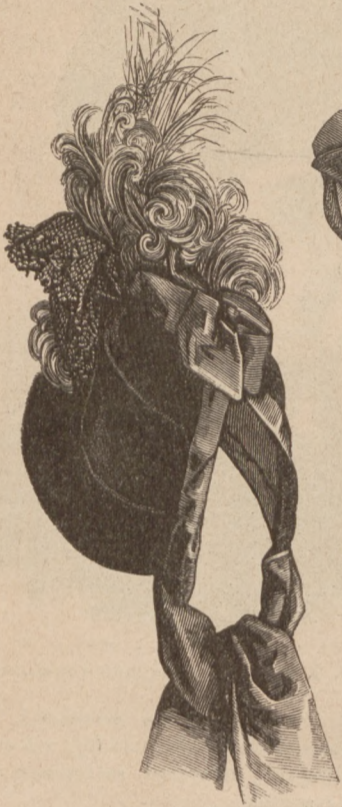
N. 15. Kapotka ze stojącym rondkiem. Patrz ryc. 2.

składa się z aksamitnych róż herbacianych i liści czarnych tiulowych, wyszytych dżetem na sztywnym tiulu, z dodaniem drucika pod żyłkę środkową. Próbkę liścia naturalnej wielkości dajemy na ryc. 41.