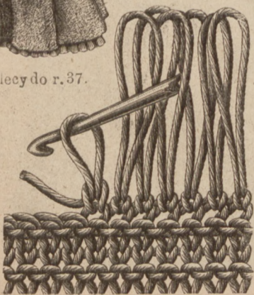
N. 17. Wykonanie fren Izli do r. 25 w N. 43.