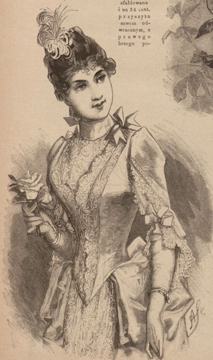
N. 37. Suknia strojna pluszowa. Patrz ryc. 16.