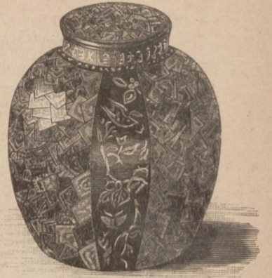
N. 12. Wazon malowany na szkło.