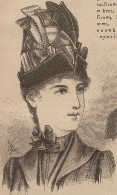
N. 3. Berek z przeciętem rondkiem.

Model do ryc. 9 i 36, odrobiony był z materiału wełnianego, gładkiego szafirowego i w kratę szafirową i pąsową. Podszewkową spódniczkę