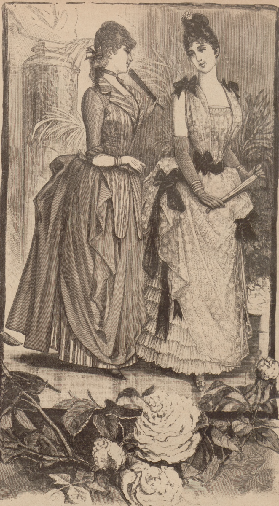
N. 35. Suknia wizytowa z długim stanikiem. Patrz ryc. 32.

przeznie podług znaków przy 45 sfaldowany, tworzy małe panier na spódnicy a lewym brzegiem boc-