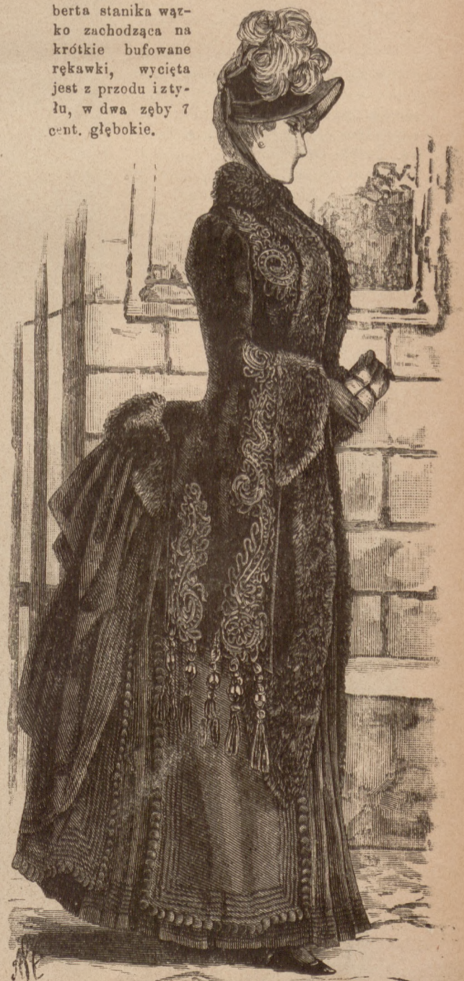
N. 10. Okrycie do spacerowego ubrania. Patrz r. 23-24 w N-rze 48.