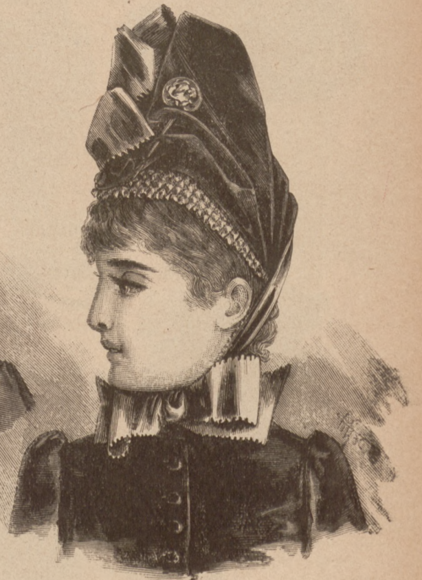
N. 4. Kapotka z odmiennym rondkiem.

ca 19 cent. długości a 144 szerokości, ułożona była w 6 cent. szerokie kontrafałdy, z 5 cent. szerokimi odstępami, naszytymi szafirowym aksamitem. Aksamitna berta stanika wązko zachodząca na krótkie bufowane rękawki, wycięta jest z przodu iztyłu, w dwa zęby 7 cent. głębokie.