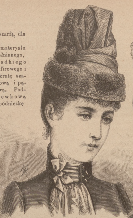
N. 1. Berek sukieny. Patrz ryc. 11.