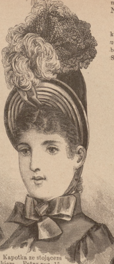
N. 2. Kapotka ze stojącym rondkiem. Patrz ryc. 15.