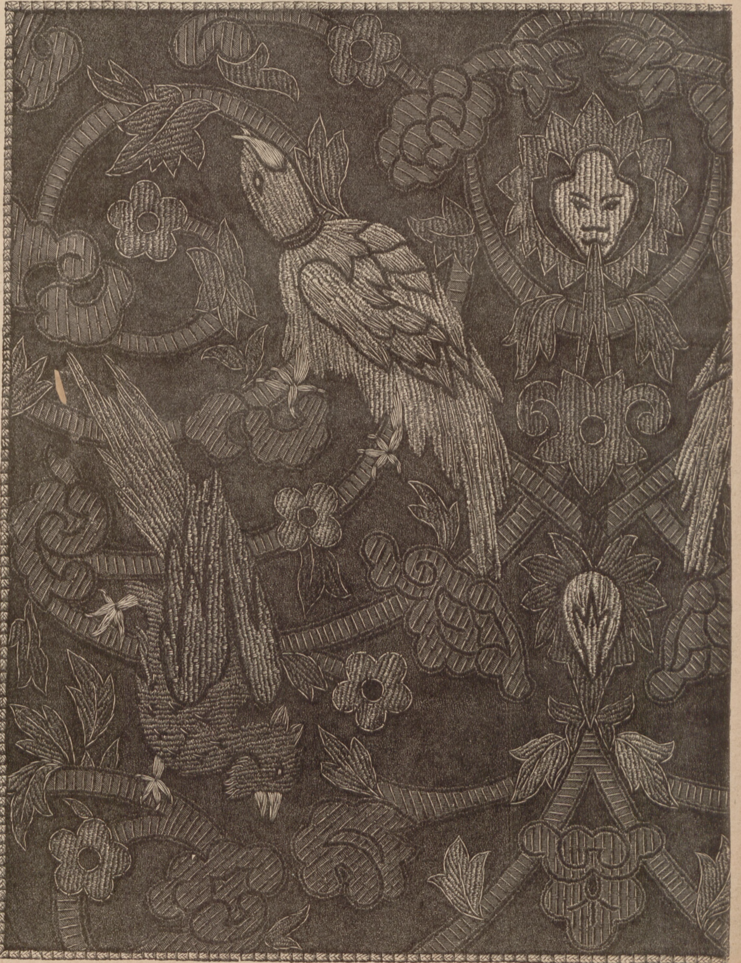
N. 18. Haft sznelą i aplikacja do ryc. 45 w N-rze 48.