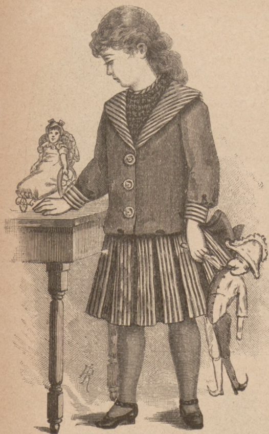
N. 34. Sukienka dla dziecka.

nym od 25 do 38 wszywa się gładko w pasek, od 38 do 60 fałduje na 13 cent. i przyczepia przy rozporoku sukni, poniżej którego podcina się pukiel składając gwiazdką do gwiazdki. Zbysające brzegi od dwukropka do dwukropka zszyte są w róg, a z prawego brzegu bocznego składa się jeszcze pukiel od dwukropka do kropki. Na lewy tylny bryt sukni spada część draperyi c, z lewego brzegu podług znaczków