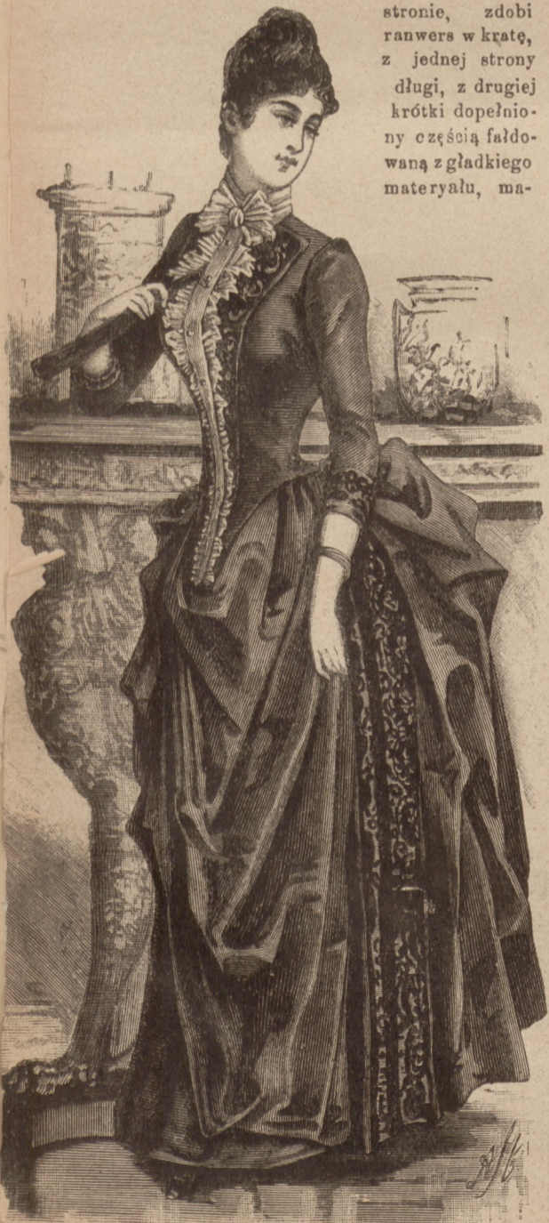
N. 9. Ubranie wizytowe. Patrz ryc. 27 tudzież ryc. 13 i 28 w N-rze 48.

37 cent. długa, oszyta u dołu 15 cent. szeroką listwą w kratę, pokrywa spódniczka zwierzchnia gładka, 32 cent. długa. Długi stanik zapięty z boku przy plastronie, zdobi ranwers w kratę, z jednej strony długi, z drugiej krótki dopełniony częścią faldowaną z gładkiego materiału, ma-