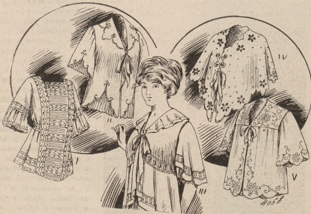
N. 13. Kaftaniki ranne.

kawa. Drugi kaftanikma brzegi wycięte w zęby i wydziergane deseniowo; u dołu i u rękawów podszyte plisowanie. Trzeci model naśladuje bolero dopełnione baskiną, kołnierzem i rękawami formą serpentine. Rycina IV przedstawia penioar formą trójkątnej chusteczki sznurowanej wstążką, ozdobionej haftem angielskim. Nakoniec V model kaftanika z karczkiem, ze zmianą rękawów na długie służyć będzie dla starszej osoby. Wszystkie te kaftaniki mogą być białe do prania, kolorowe z lekkiej wełny, lub jedwabne; kokardy z wstążki bardzo przyozdabiają każdy kaftanik.