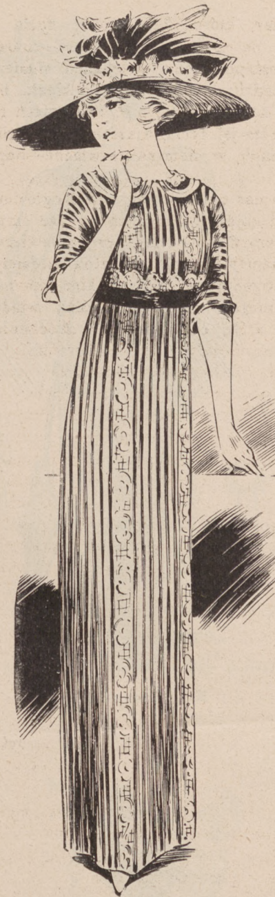
N. 2. Suknia z materyi w pasy.

widać bluzkę batystową haftowaną. Kapelusz ze słomki czarnej z białym, objęty z brzegu czarnym aksamitem, przybrany wstążką zieloną.