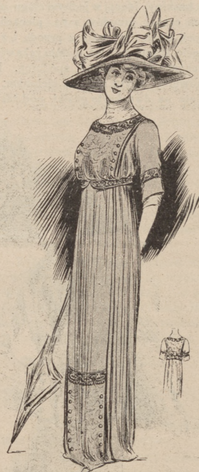
N. 6. Suknia z plastronem.

Materya w pasy białe i czarne łączy się z voile jedwabnym koloru vieux rouge; szlaki, wyszycie czarnym jedwabiem, stanowią