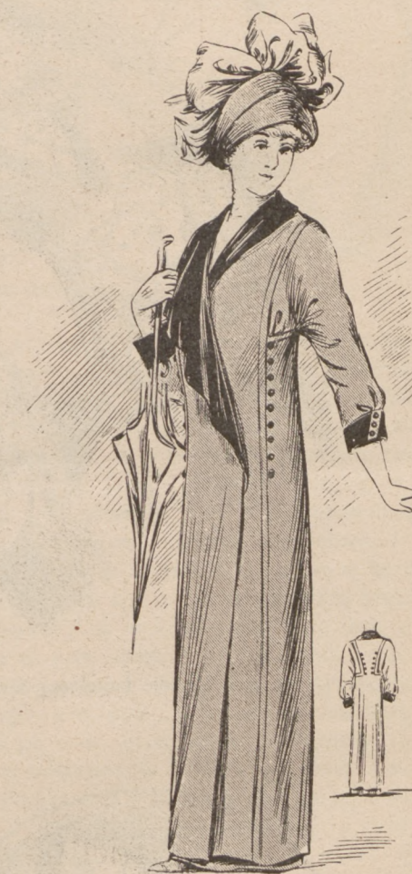
N. 11. Płaszczki letni.

lasu radzimy poprzestać na materyale do prania, bo taka charlotte najpraktyczniejsza. Wymiar główki i falbany stosuje się i zmienia podług każdej głowy; całość szyje się z piki, batystu, czy ciemnego płótna haftowanego — foremkę zastępuje pasek sztywnego muslinu, podszyty drutem. Można użyć również batystu, tegoż koloru co sukienka, dać plisowaną drobnutko falbankę i podszyć od spodu lub przykryć zwierzchu koronką valenciennę. Osoba niewprawna może przykrajając okragłe denko z bibułki angielskiej, zfałdować około brzegu i przymierzyć na głowie aby ocenić czy lepiej do twarzy robi szersza i płaska czy też węższa stojąca główka. Ładnie wygląda ją kapelusze kolorowe, pokryte cienkim białym muslinem.