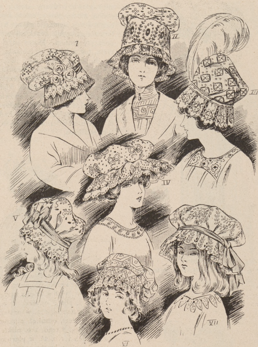
N. 12 Modele kapeluszy letnich ogrodowych lub spacerowych na wsi.