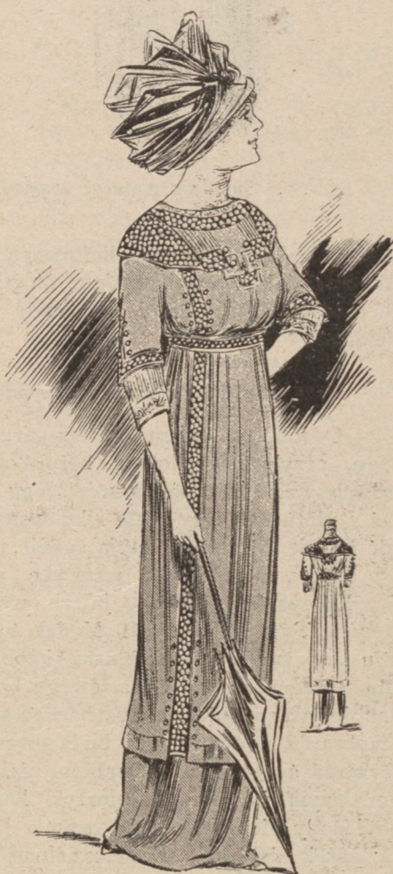
N. 7. Suknia z tuniką.

Na gładkiej spódnicy z kreponu jedwabnego, koloru śliwkowego (prune de Monsieur), spada długa prosta tunika objęta skosem z taffetas tegoż koloru a wzdłuż prawego boku otwarta na podłożonym klinie z fularu czarnego w białe grochy, rzucone niesymetrycznie. Kołnier, pasek, przybranie rękawów i bluzki kimono dane z tegoż fularu; szmizet-