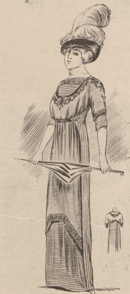
N. 10. Suknia wizytowa

lasu radzimy poprzestać na materyale do prania, bo taka charlotte najpraktyczniejsza. Wymiar główki i falbany stosuje się i zmienia podług każdej głowy; całość szyje się z piki, batystu, czy ciemnego płótna haftowanego — foremkę zastępuje pasek sztywnego muslinu, podszyty drutem. Można użyć również batystu, tegoż koloru co sukienka, dać plisowaną drobnutko falbankę i podszyć od spodu lub przykryć zwierzchu koronką valenciennę. Osoba niewprawna może przykrajając okragłe denko z bibułki angielskiej, zfałdować około brzegu i przymierzyć na głowie aby ocenić czy lepiej do twarzy robi szersza i płaska czy też węższa stojąca główka. Ładnie wygląda ją kapelusze kolorowe, pokryte cienkim białym muslinem.