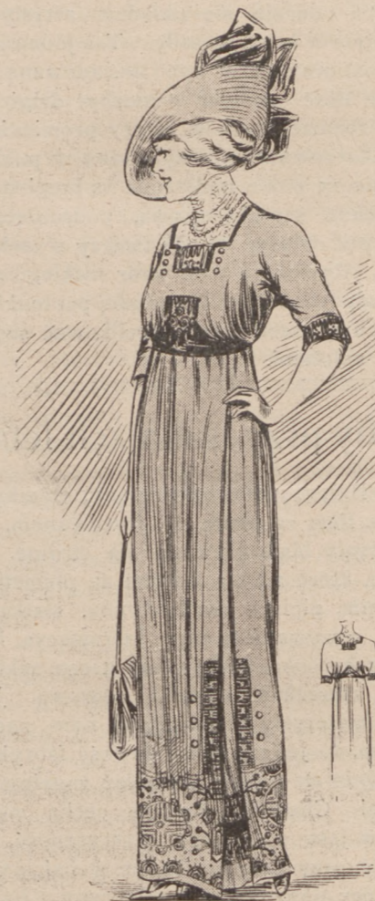
N. 8. Ubranie wizytowe.

Podajemy grupę kapeluszy letnich, które w mieście nosić mogą wyłącznie dzieci