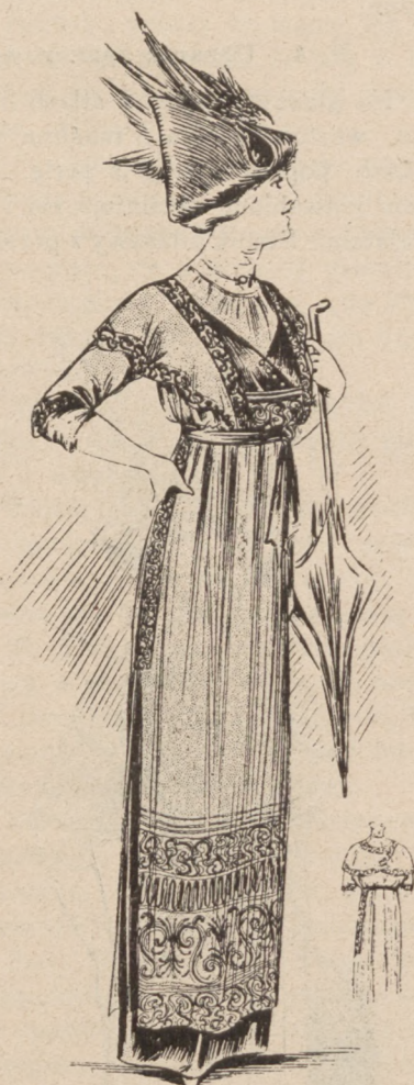
N. 4. Ubranie spacerowe.

Odrobione z voile białego (craie), przybrane materyą taffetas glacé niebiesko zieloną, na której dane wyszycie sutaszem tego co materya koloru; odpowiednio do szerokiej plisy w około sukni, dany karczek na bluzce kimono i wąskie wykłady na rękawach, z pod których wysuwają się koronkowe mankiety. Kapelusz biały, przybrany wstążką niebieską z zielonym spodem.