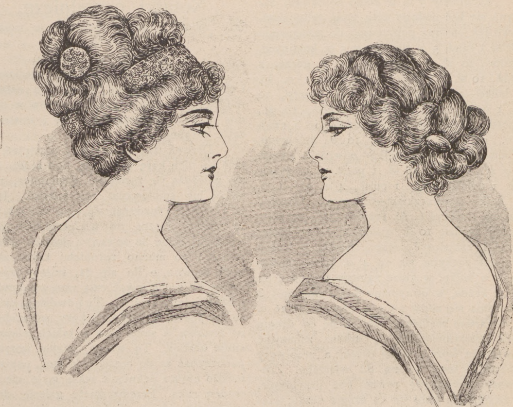
N. 14--15. Modne uczesanie.

Teraz przechodzi się do odrobienia szerokich liści spodnich, z których trzy są