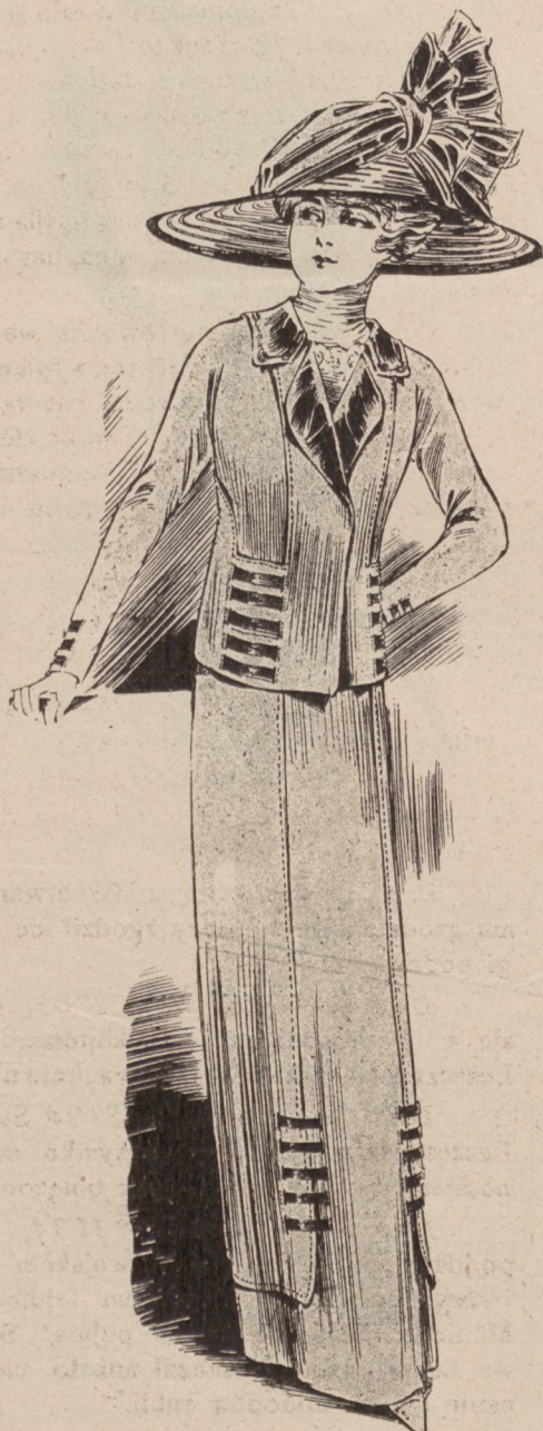
N. 1. Ubranie spacerowe.

Kostium tailleur, przedstawiający się bardzo skromnie na pierwszy rzut oka, przy rozpatrzeniu wykazuje wykończenie podług najświeższej mody. Przez etaminę tkaną w grube nitki koloru popielatego (taupe), przebija tworząc słoje morowe, materya jedwabna szmaragdowego koloru. Spódnica z boków i z tyłu, odcięta krócej, nasładuje tunikę otwartą na wązkim brycie przednim krajany, w jednym ciągu z szeroką prostą plisą, dopełniająca w około suknię. Połączenie tuniki ze spódnicą, stanowią pliski z atlasu szmaragdowego, przewleczone pięcioma rzędami przez dziurki przecięte i objęte skosem materyi popielatej. Żakiecik zwraca uwagę krojem baskiny, idącej w jednym ciągu od pierwszych części przodów a na plecach zachodzącej, bardzo wysoko; z przodu i z tyłu ma wcięcie stanu, tudzież u dołu rękawów przewleczone pliski jak na spódnicy. Kołnierz i ranwersy kryte atlasem zielonym; przody zapięte na dwa kryte guziki, pod żakiecikiem