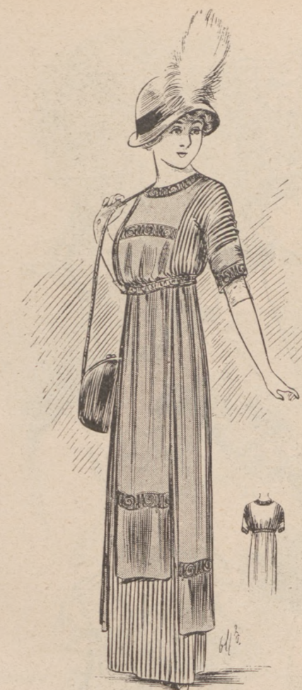
N. 9. Suknia z dwojakiego materyału.

i niedorośle panienki, ale za to na wsi, u wód i kąpieli, albo nad morzem służą dla osób wszelkiego wieku; woalki nie przypina się do takiego kapelusza, Fason ten nazwany charlotte od imienia pierwszej swojej twórczyni i właścicielki (sławnej aktorki), miał pierwotną formę taką, jaką przedstawia ryc. IV i VII, która utrzymuje się stale w użyciu od lat kilkunastu i robi bardzo do twarzy, otaczając lekką falbanką jakby ramką świeżą twarzyczkę. Zwolenniczki nowości, klasyczną formę faldzistej czyli bufiastej główki, jak u bercika , zmieniają na wysokie denka (ryc. I, II, III, V); to rzecz gustu, sposobu uczesania i rysów twarzy. Kwiaty i pióra zdają się dodatkiem za pretensjonalnym — wystarcza opaska z wstążki; na wieś do ogrodu czy do