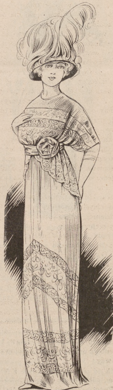
N. 3. Suknia batystowa haftowana.

Na gładkiej sukni z atlasu liberty gris taupe, włożona tunika z muślinu jedwabnego jasno popielatego gris perle, ozdobiona haftem jedwabiem ciemniejszym i perełkami popielatymi. Stanik atlasowy z przodami krzy-