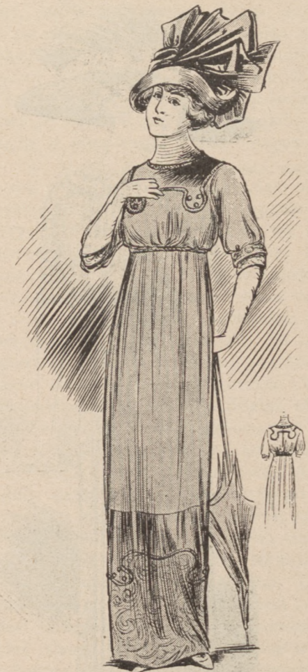
N. 5. Ubranie wizytowe.

ka i spodnie rękawy z tiulu Alençon. Kapelusz biały przybrany wstążką mienioną śliwkowo z czarnym.