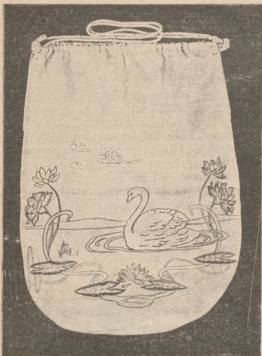
Worek do używanej bielizny.

skie lub koroneczki klockowe. Szycie maszynowe, bo tańsze. Ale bielizna może być bardzo piękna i równie starannie odszyta, jak najwykwintniejsza — tylko o wiele od płótna i batystów tańsza.