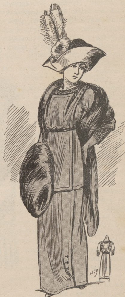
N. 7. Kostium do wizyt dziennych.