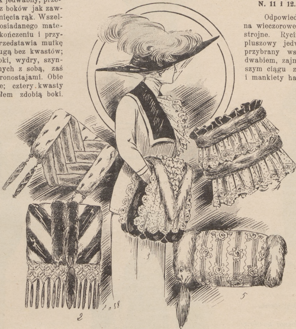
N. 1—5. Mufki łatwe do uszycia w domu.

Mniej strojny, niż suknie d'après midi , a jednak bardzo szykowny kostyum z aksamitu białego w czarne paski, przybrany czarnym pluszem i takiemż guzikami, ma spódnicę tunikową i krótki żakiet ze szmizetką tiulową z koronką—takież talbany urekawów rozszerzonych u dołu. Kapelusz aksamitny