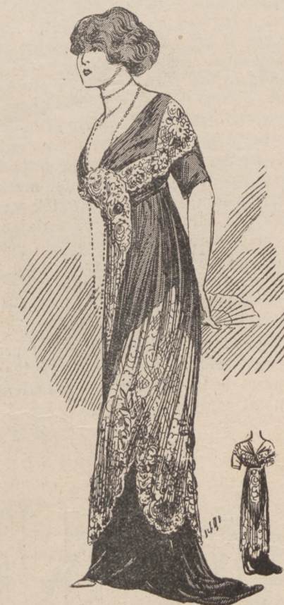
N. 13. Ubrania na obiad proszony

bnie wianuszki, między którymi wila się wstążeczka w obrobionych ręcznie dziurkach. Koszula długa była winkrustowana w karczek... Rękawy pół długie dość szerokie żdobne tym samym wzorem, oszyte walencienką i przewleczone wstążeczką, która na koszuli miała aż 112 małych tunelików, którymi wędrowała—ku ozdobie wykintnej bielizny.