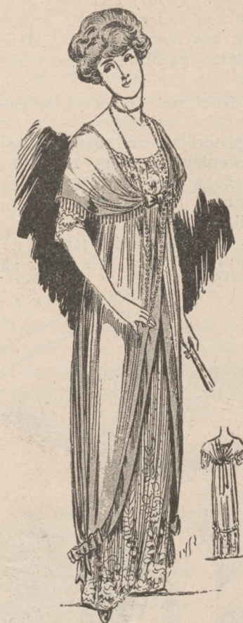
N. 8. Ubranie wieczorowe.

Suknie obcisłe na biodrach, modne od lat kilku, secesyjna wysmukłość konturów modnej sylwetki kobiecej, staniki wycięte, krótkie rękawy, pończochy ażurowe cienkie, jak koronka, wycięte pantofelki, noszone w zimie, wszystkie te wybryki mody, z największym uporem zachowywane przez młode osoby, lekomyślnie dla mody narażające zdrowie, są powodem zaziębienia dla wielu, przyczyną gorzkich łez matek. Jeżeli ślepo naśladujemy wybryki mody (mimo różnicy klimatu), idącej z Paryża, naśladujemy równocześnie i praktyczność paryżanek, które pod wylizaniem powyżej ubranem noszą zabezpieczające od zimna dodatki. W Paryżu do rzędu najświeższych nowości zimowych należą wyroby nowego gatunku, pośrednie między wełną, jedwabiem i futrem ( composition de fourru-