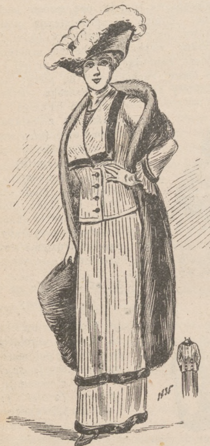
N. 6. Kostium do przechadzki pieszo.

Bielizna pod suknie balowe i wieczorowe, obiegające gładko biodra, używana jest powszechnie formą łączącą koszulę z majtkami, albo na koszuli formą empire kładą się majtki złączone ze stanikiem na gorset; oba połączenia mają nazwę ogólną combinaison . Formy odpowiednio dajemy na arkuszach z krojami, dołączanych do „Tygodnika MÓD”. Młode osoby zbyt pretensjonalne, odrzucają spódniczki krótkie noszone pod suknią, bojąc się pogrubienia choćby o 1/2 centymetra. Takim strojnisiom radzimy spódniczki trykotowe, obiegające figurę jak rękawiczka, u dołu zakończone falbanką plisowaną jedwabną. Zamiast trykotowej można nosić spódniczkę z kaszmiru jedwabnego, który w dobrym gatunku jest niezmiernie trwały.