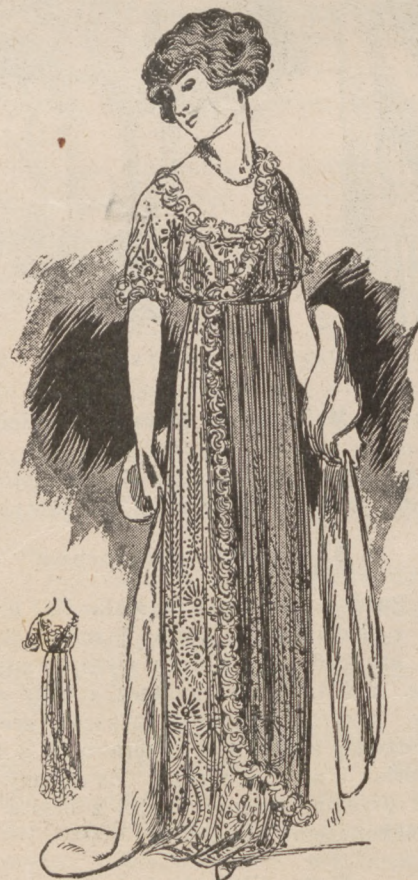
N. 9. Ubranie balowe.

re ), tak miękkie i miłe, że można je nosić wprost na ciele i wtedy dają najwięcej ciepła; z wyglądu podobne do trykotu przezroczystego. Elegantki noszą takie szmizetki wycięte czyli krótkie bluzki, takie majtki, takie pończochy; wszystkie te przedmioty są koloru cielistego, więc nie odróżniają się nawet pod klarownym materyałem. Na rękawiczki balowe można wsunąć rękawiczki białe wełniane i zdjąć przybywszy na miejsce. Cielistego koloru pończochy (fil d'ecosse) włożone pod ażurowe są niewidoczne a zabezpieczają od zimna. Osoby delikatnego zdrowia powinny pod staniki balowe nosić staniczek trykotowy jedwabny lub choćby bawełniany, z tyłu zapinany, z rękawkami krótkimi lub długimi, stosownie do sukni. Królowa angielska pod najstrojniejsze suknie nosi dwie spódniczki flanelowe—może jej przykład zachęci osoby delikatnego zdrowia, których jest większość.