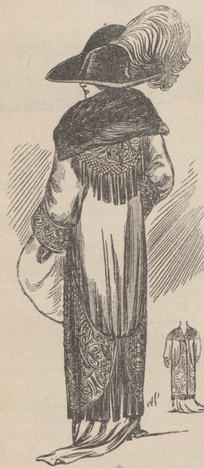
N. 11. Płaszczk wieczorowy.

Zdziechowska, której szycie i wykończenie bielizny rywalizować może tylko z najwytworniejszymi francuskimi i belgijskimi robotami.