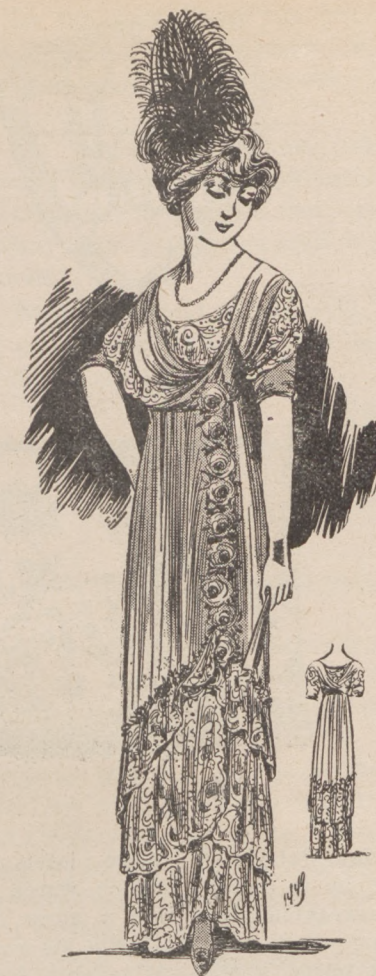
N. 10. Ubranie wieczorowe.

Karczek, u szyjki nieco otwartej, był dziergany w ząbki, z pod których widniał rąbek wąskiej walencienki. Cały zaś miał rozrzucone gwiazdki ażurowe i ażurowe dro-