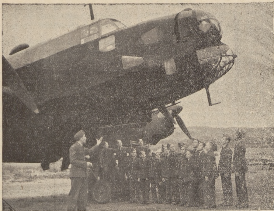
Polscy „Harczerze Powietrza” zapoznają się z bombowcem „Halifaxem”.