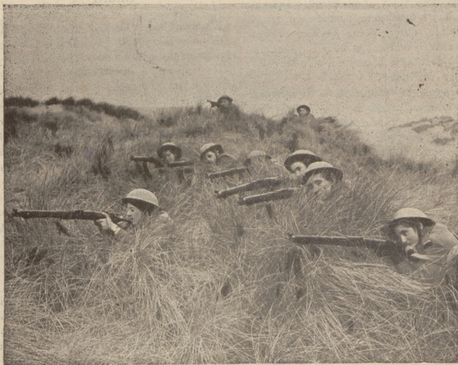
Oddział Polskiej Kobięcej Służby Pomocniczej