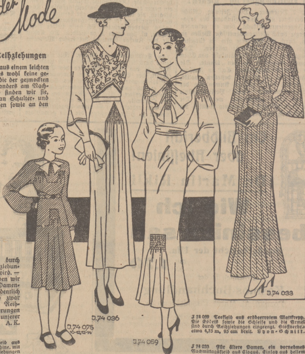
J 74 075