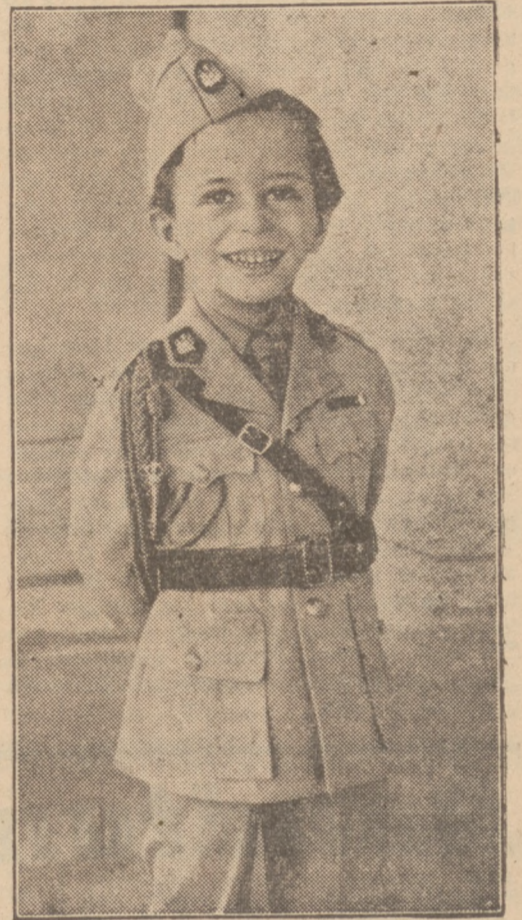
Der kleine König vom Teal

Soweit der „Dobry Wiczejor“. Der Wiczejor Warszawski äußert sich im gleichen Sinne und versichert, daß er alle Schritte unternommen habe, um die Meldungen, die von ausländischen Korrespondenten in Berlin weitergegeben würden, auf ihre Richtigkeit nachzuprüfen. Es habe sich herausgestellt, daß alle Gerüchte über eine „neue Phase deutsch-polnischer Verhandlungen“ aus den Fingern gelogen seien. Das Blatt fragt, wer und mit welchem Zweck derartige unwahre Nachrichten in die Welt herausende.