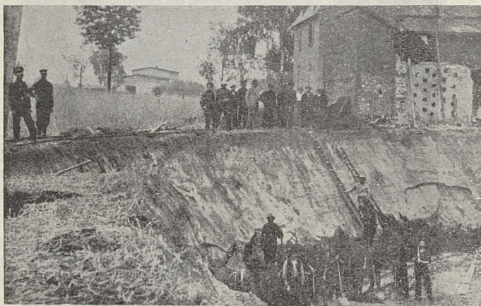
Fragment usypiska w Lędzinach z członkami Straży Pożarnej z Lędzin przy pracy

Zbiegiem okoliczności czy to przy samej katastrofie na powierzchni, jak i w podziemiach kopalni, gdzie oprócz maszynistów przy pompach nie było żadnej innej duszy, wypadek ten nie pociągnął żadnych ofiar ludzkich za sobą, również nic przy bardzo nie-