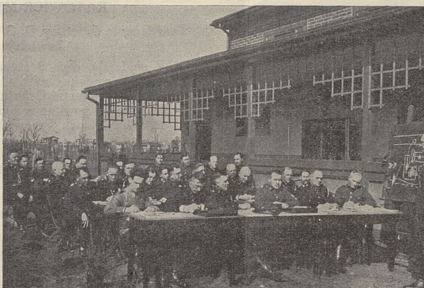
Kurs pożarniczy VI stopnia przeprowadzony przez Śl. Okręg Wojew. w czasie od 21 III do 26 III 1938 r.

Program powyższych kursów obejmował 6 godzin wykładów z zakresu prac świetlicowych i oświatowych oraz 30 godzin zajęć praktycznych, jak śpiewy, deklamacje, recytacje, inscenizacje, tańce ludowe, gry i zabawy, czytelnictwo.