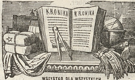
WSZYSTKO DLA WSZYSTKICH.

Obwieszczenia przyjmuje Redakcyja Kroniki za opłatą: Od wiersza drobnym drukiem za jednorazowe umieszczenie kop. 3, za następne po kop. 2 1/2. Każdy prenumerator Kroniki ma prawo zamieścić w niej bez opłaty, doniesień własnych za 50 kop. kwartał.