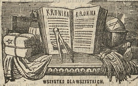
WSYSTKO DLA WSYSTKICH.

Do Kroniki Wiadomości Krajowych i Zagranicznych , jako praemium dla prenumeratorów, dodane zostaną na kwartał dwa tomy treści historycznej, powieściowej, literackiej i ekonomicznej, składające się każdy z 250 stron, za cenę druku i papieru po kop. 25 za tom. Obwieszczenia przyjmuje Redakcja Kroniki za opłatą: Od wiersza drobnym drukiem za jednorazowe umieszczenie kop. 3, za następne po kop. 2 1/2. Każdy prenumerator Kroniki ma prawo zamieścić w niej bez opłaty, doniesień własnych za 50 kop. kwartał.