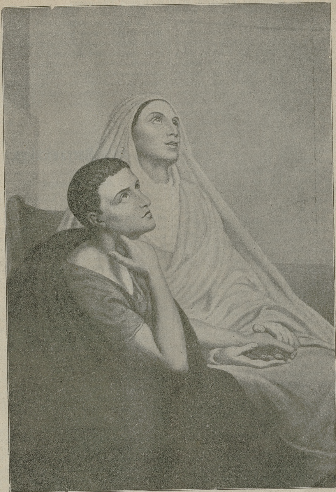
Św. Augustyn z matką swą św. Moniką.