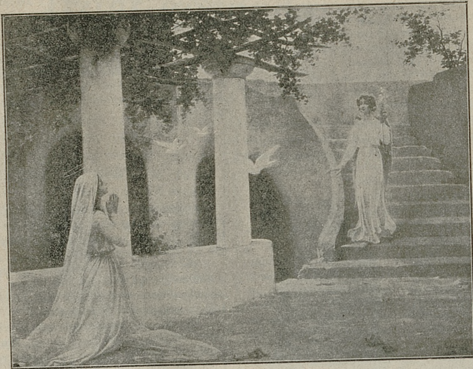
Zwiastowanie Najświętszej Maryi Panny.

które nie mogą zmieniać konwencji, zawartej przez sprzymierzeńców. Przedstawiciele sztabów spotkali się tylko trzy razy. W czasie pierwszego spotkania nie było mowy o jakichkolwiek zmianach; w czasie drugiego Bułgarzy prosili o redukcję kontyngentu, przeznaczanego do doliny Wardaru, lecz delegaci serbscy odrzucili żądania; w czasie trzeciego spotkania po mobilizacji, Bułgarzy oświadczyli kategorycznie, że nie mogą wysłać do Macedonii 100 tysięcy żołnierzy. Serbia miała do rozwiązania dylemat: zerwać sojusz, albo wziąć na siebie losy Serbii i stolicy bułgarskiej. Serbia musiała zmobilizować zamiast 150 tysięcy—400 tys. Serbia nie zaprzecza ważności traktatu, lecz, domagając się jego rewizji, opiera się na zasadniczych jego postanowieniach.