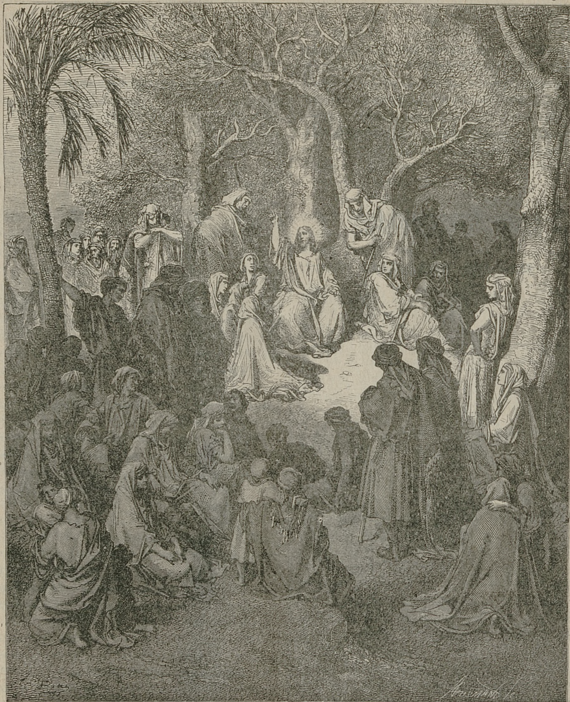
Kazanie Pana Jezusa na górze.

Osiem błogosławieństw. „Błogosławieni miłosierni, albowiem oni miłosierdzia dostąpią“.