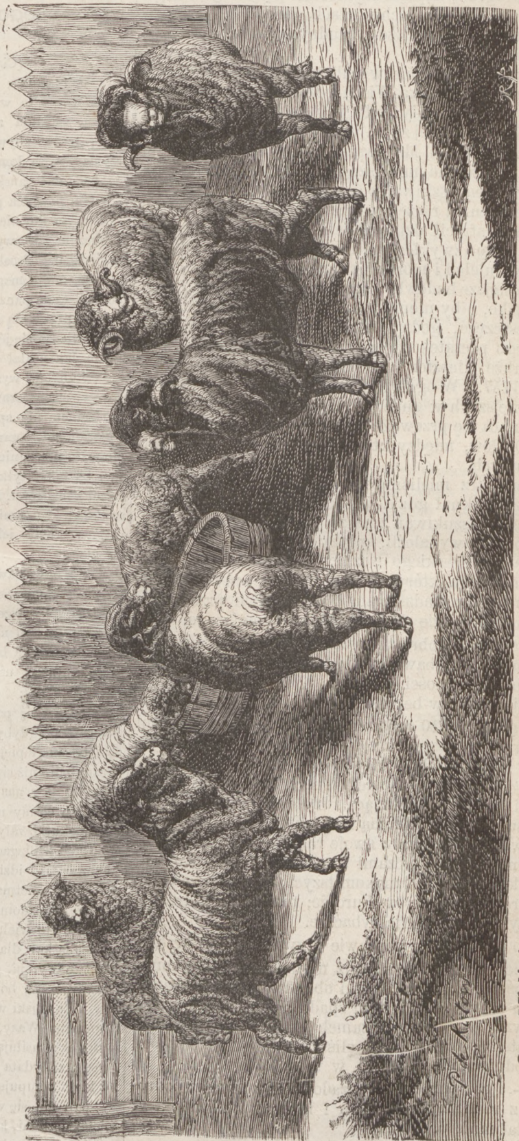
Owce I Mielżyńskiego i Chłapowskiego z W. Ks. Poznańskiego, wynagrodzone medalem złotym na wystawie Paryskiej 1867 r.