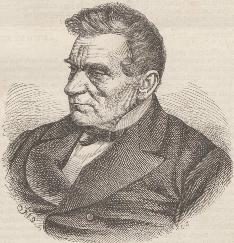
Karol Libelt. — (Strona 331-a).

Takich społeczność czci i szanuje, u ogniska domowego daje im zaszczytne miejsce i patrzy z współczuciem na spokojny lub tęskny wyraz ich twarzy,