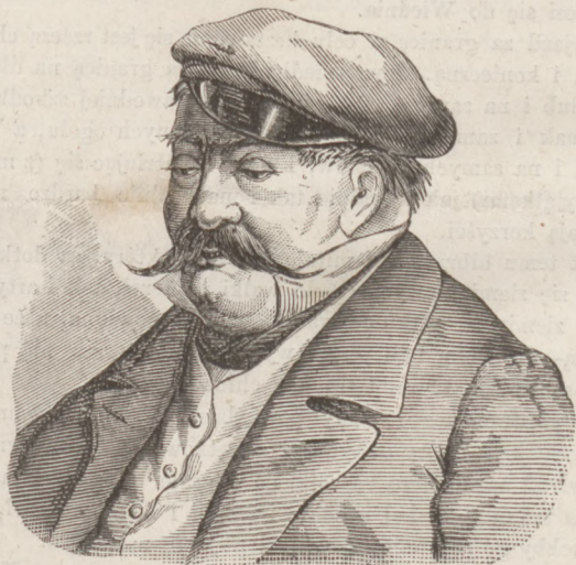
Wąsy obywatelskie czyli szlacheckie. (d. c. n.)

cem nad patelnią tak, że łapy dotykają się naczyń. Z wielkiego gorąca nabrzmiwiają łapy i krew ściąga się do nich. Po dwóch lub trzech minutach maczają łapy w korzennych przyprawach i znowu trzymają je nad patelnią. Po takiej kilkokrotnej operacji, zbiega wszystka krew z ciała do nóg, które pęcznieją do grubości kilku cali, a zarazem przesiąkają korzeniami i tak jadane bywają same jako największy przysmak. Inna recepta kuchni Chińskiej jest następująca: w przyrządzonej umyślnie na to zamkniętej wannie glinianej, zamykają żywe jagnię, wstawiając tam zarazem kilka garnków z winem, octem, solą i t. p., a potem rozpalają pod nią wielki ogień. Z gorąca dostaje biedne zwierzę wielkiego pragnienia i wypija wszystkie płyny znajdujące się w garnkach, poczem pada wycieńczone i w krótkim czasie wychodzi z pieca jako wyborna pieczeń.