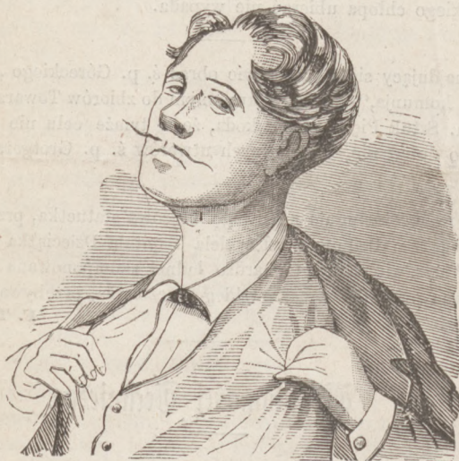
Wąsy in spe (w nadziei).