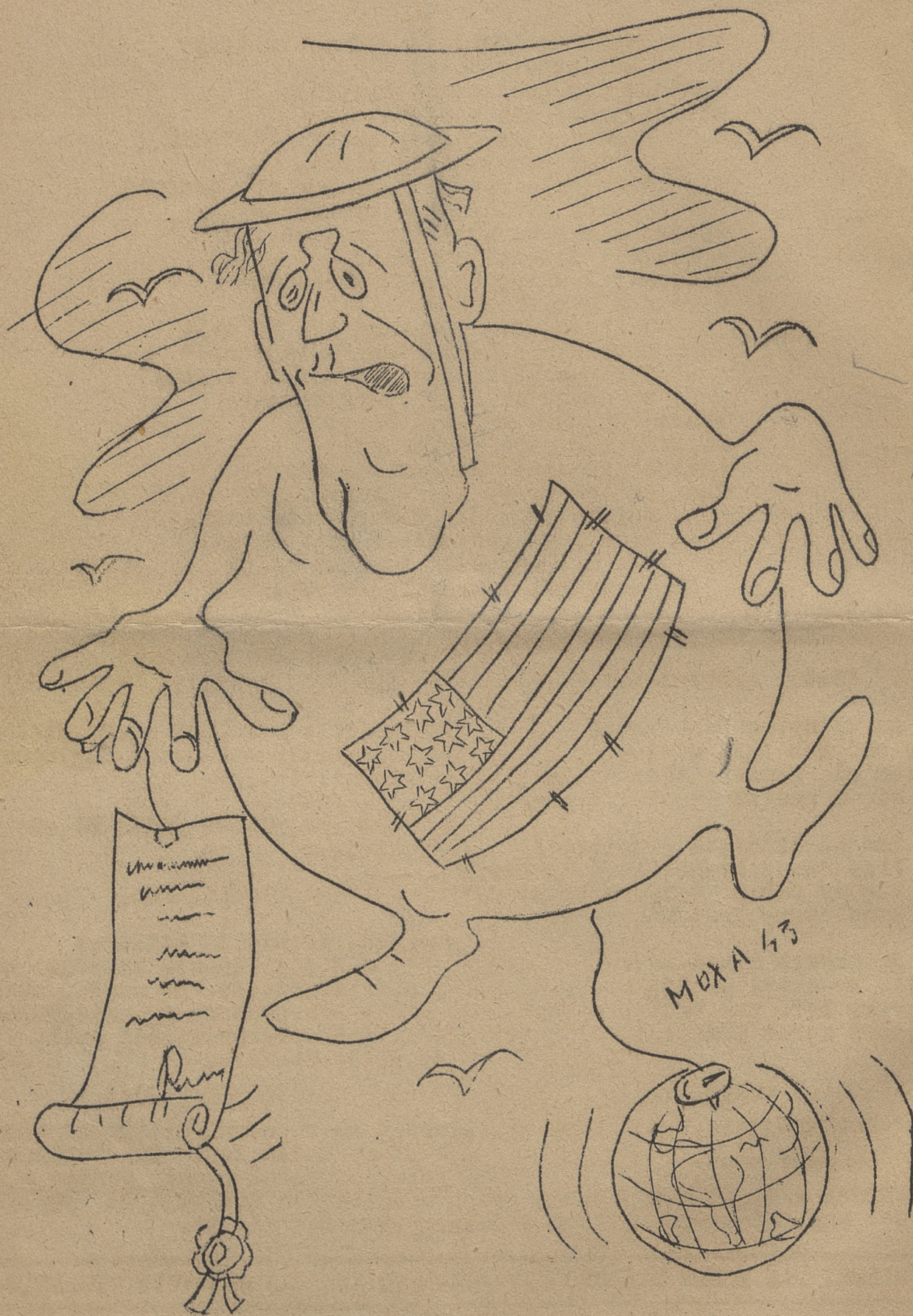
PREZY - DENT ROOSEVELT