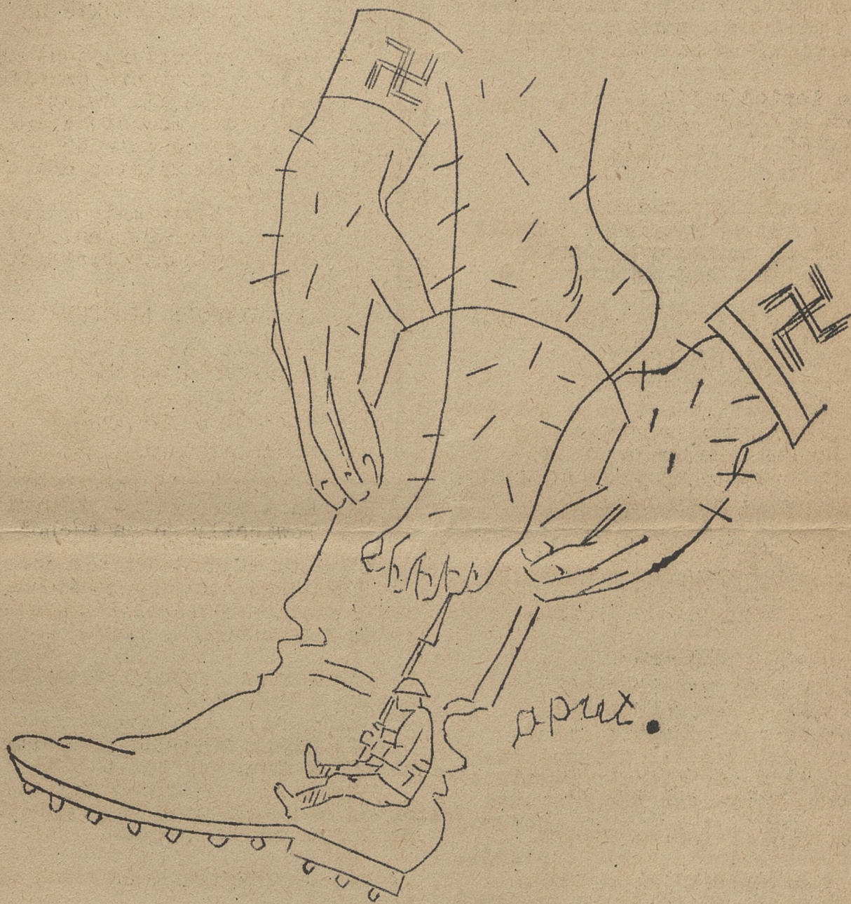
PROBLEM WŁOSKIEGO BUTA...