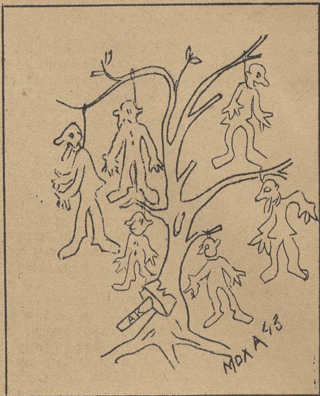
Drzewo genealogiczne Franka