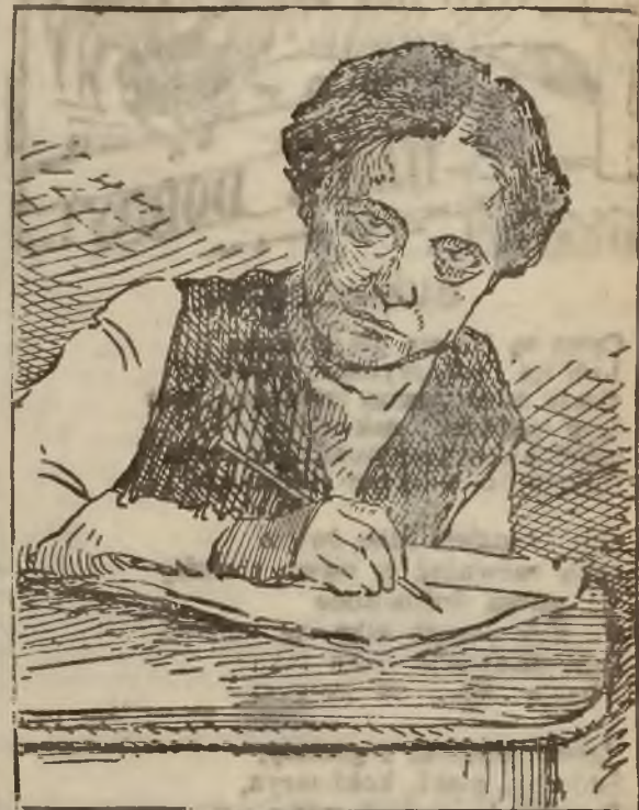
Zona Len'na, przewodniczącego Sowietów rosyjskich, cicha i sprytna współpracowniczka w działalności męża swego, zwanego „Krwawym carem Rosyi”.