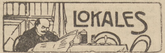
Thorn, 9. Februar.

Polen. Vom Zuge überfahren wurde auf dem Zentralbahnhof ein junger Bahnarbeiter aus Gurtschin, der zwischen den Gleisen mit Schneeschaufeln beschäftigt war. Der Tod trat nach wenigen Minuten ein.