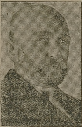
B. premier plk Walery Slawek.

WILNO, 29. 5. Według wiadomości z Rygi przez terytorjum lotewskie do Niemiec przeszła 10-ta z kolei partja złota sowieckiego. Bezpośrednie prze- znaczenie tej przesyłki podobnie jak poprzednich nie jest znane. Złoto u- mieszczone było w opancerzonym wa- gonie zapakowane w 80 drewnianych skrzynkach ogólnej wagi 4000 kilogra- mów. Jest to najmniejsza partja złota sowieckiego, jaka dotychczas przeszła przez Łotwę do Niemiec.