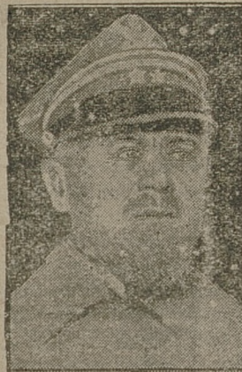
Premier pplk. Aleksander Prystor.

wa reorganizacji ministerjum skar- bu i podział pracy pomiędzy pod- sekretarzy stanu. Reorganizacja ta nastąpi w krótkim czasie.