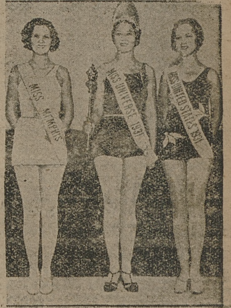
otrzymała w tym roku belgijska, którą widzimy na ilustracji w otoczeniu dwóch vice - miss.