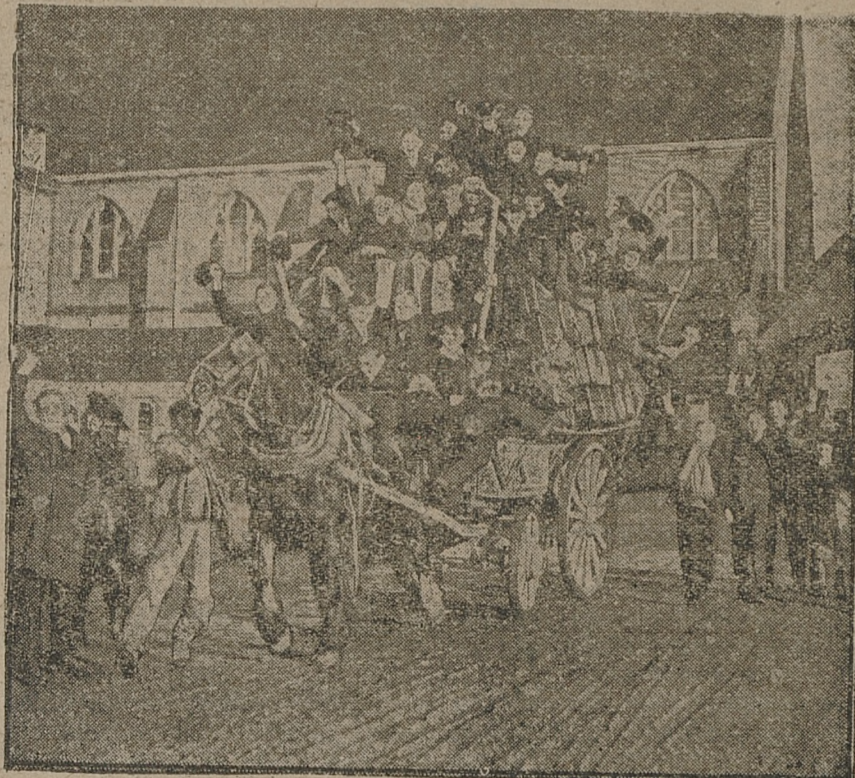
W Anglii, kraju tradycji, młodzież wyjeżdżająca ze szkół na wakacje, opuszcza uczelnie z pewnego rodzaju wesołym ceremoniałem. Oto taki obrazek.