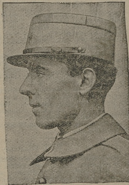
Stare „kepi” powróciły...

NOWY dom do sprzedania z wolnym mieszkaniem 4 pokojowym, kuchnią i ogrodem, od dziś, ewentualnie do wynajęcia odpowiednio na sklep kolonialny i inny, mieszkanie prywatne dla lekarzy lub polestrantów. Przy sprzedaży domu do przyjęcia długoterminowa 7 proc. hipoteka. Wiadomość administracja „Expresu Zagłębia”.