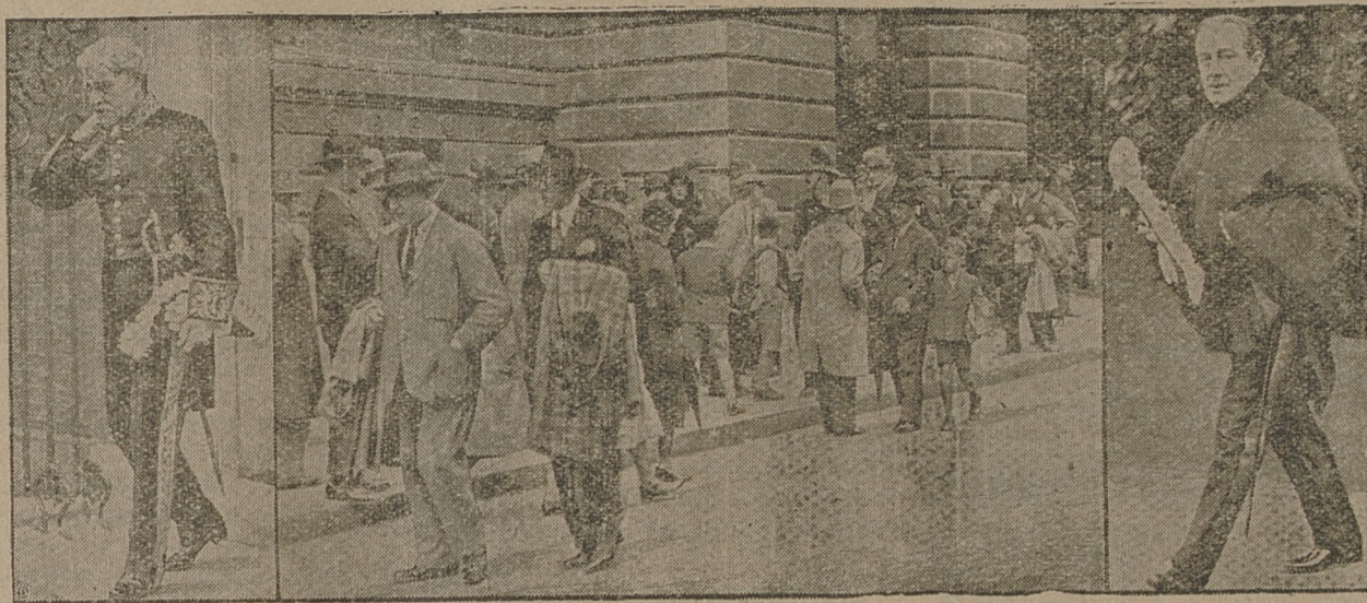
Ministrowie dymisjonowanego gabinetu opuszczają pałac rządu przy Downingstreet. Na lewo premier Mac Donald, na prawo Baldwin, przywódca konserwatystów. Obrazek środkowy przedstawia tłumy ludności, która zebrała się przed pałacem premiera, w chwili przesilenia gabinetowego.