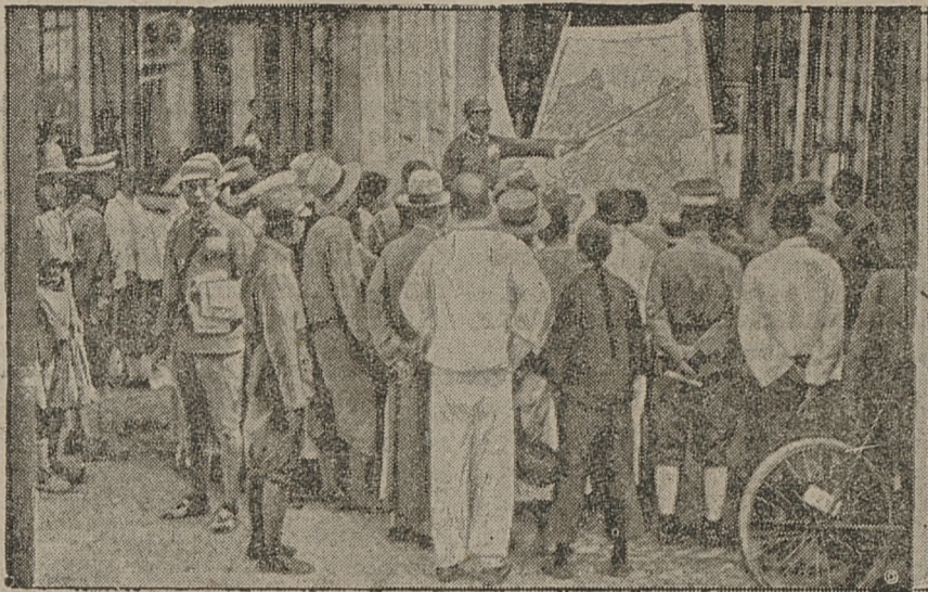
w Mandzurji, wywołał żywe protesty w Chinach. Ilustracja nasza przedstawia zgromadzenie uliczne w Nankinie.