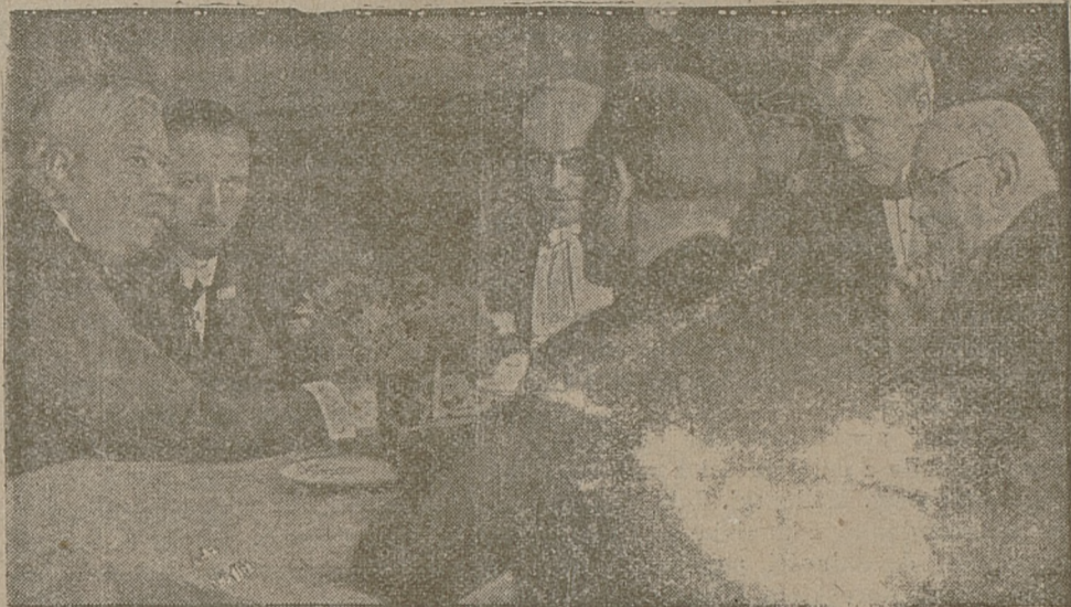
w rozmowie z kanclerzem Brüningiem.