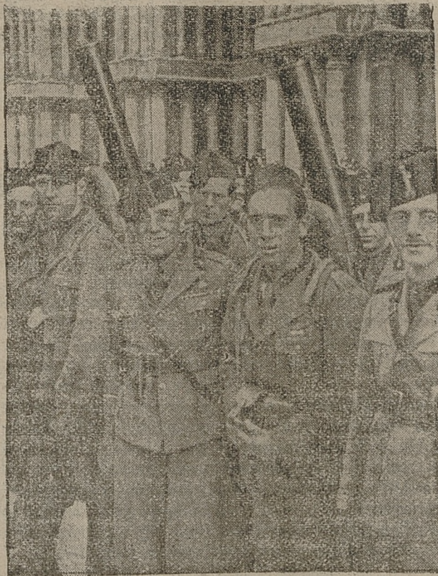
W Wenecji odbyła się wielka rewja milicji faszystowskiej. Na zdjęciu widoczny oddział milicji z karabinami maszynowymi.