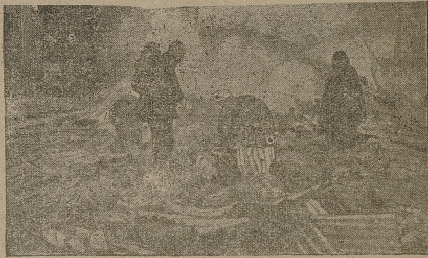
W Chinach, kędy przeszła zawierucha wojenna — pozostały zgłiszczą i ruiny. Rodziny z pogrzebisk dozywają resztki skromnego dobytku, który ocalał wśród zgłiszcz.