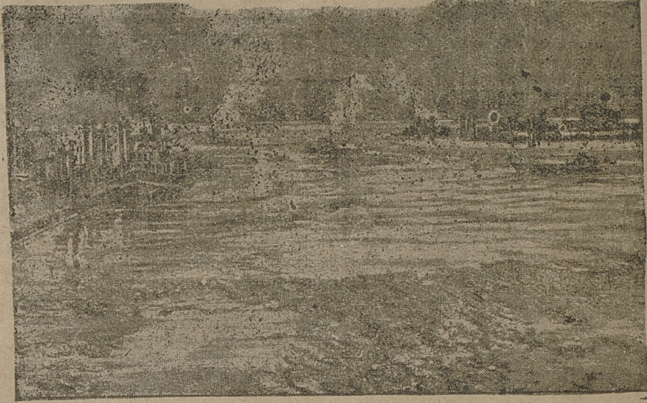
Na dalekiej północy zima niecierpliwie ustępuje ze swych surowych praw. W Islandji rozpoczyna się sezon żeglugowy, jak to widzimy na ilustracji.