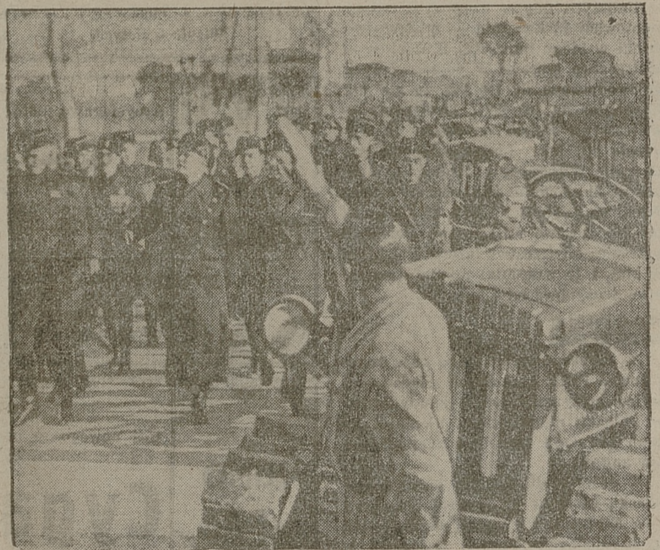
Wielkie roboty podjęte przez Mussoliniego przy osuszaniu błot pontyjskich — zostały niemal zakończone. Na miejscu dawnych trzęsawisk — wyrosło miasto, całe kilometry ziemi wróciły pod uprawę. Na zdjęciu — Mussolini podczas inspekcji osuszonych terenów, które nazwane zostały 93 prowincją włoską.