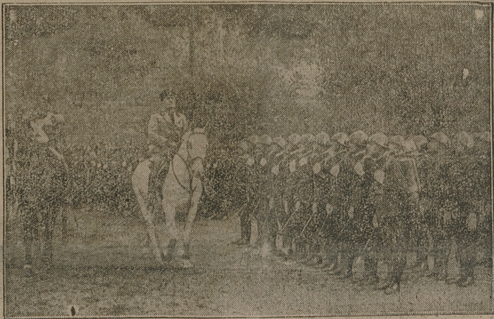
Mussolini dokonuje przeglądu oddziałów żandarmerji, które odjeżdżają do Afryki.