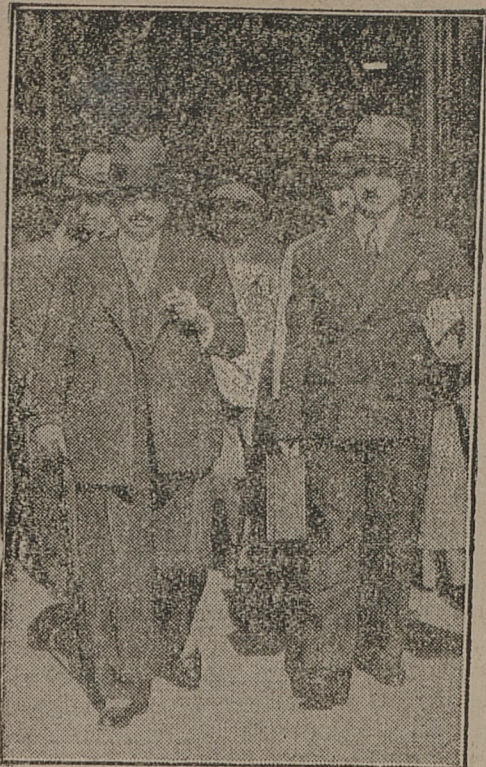
Premjer Laval przybył do Genewy, aby zająć się sporem włosko-abisyńskim na posiedzeniu rady ligi narodów.