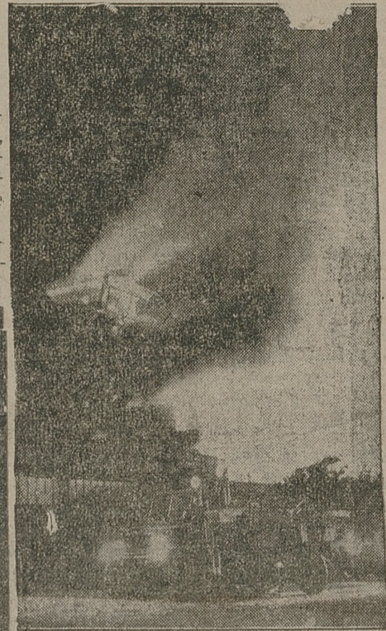
W czasie pożaru wystawy radiowej w Berlinie płomienie wystrzelały na 50 m. w górę.