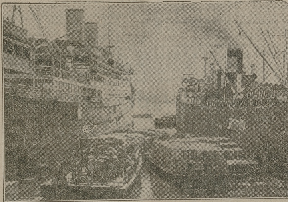
Ładowanie amunicji i żywności na okręty, odpływające do Afryki.