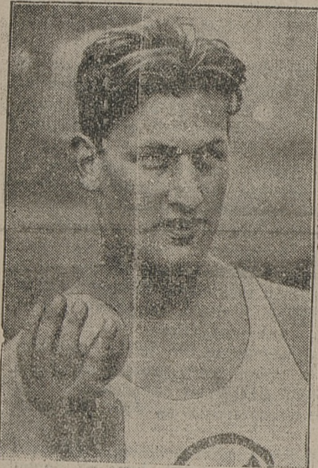
Nasza sława sportowa, Heljasz, mistrz świata w rzucie kulą.