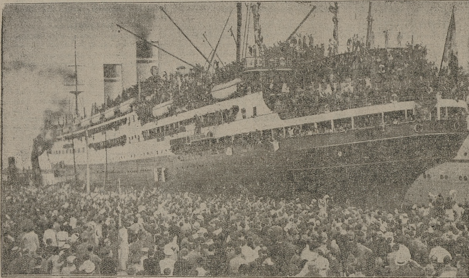
Codziennie z portów włoskich odpływają okręty wiozące żołnierzy do Afryki. Na zdjęciu tłumy najbliższych żegnają odjeżdżających żołnierzy włoskich.