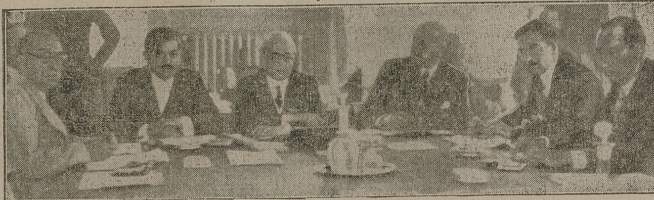
Ostatnie posiedzenie „Komitetu pięciu” w Lidze Narodów. Przy stole siedzą od lewej strony ku prawej: premier Laval, prezes komitetu Madariaga, sekretarz ligi narodów, Avenol, angielski minister Eden i minister Beck.