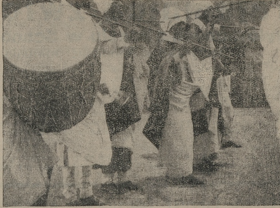
Żaden marsz wśród Abisynczyków nie odbywa się bez muzyki i śpiewów wojennych. Oto fragment marszu.