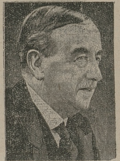
Henderson, długoletni przywódca angielskiej Partji Pracy, zmarł przed trzema dniami.