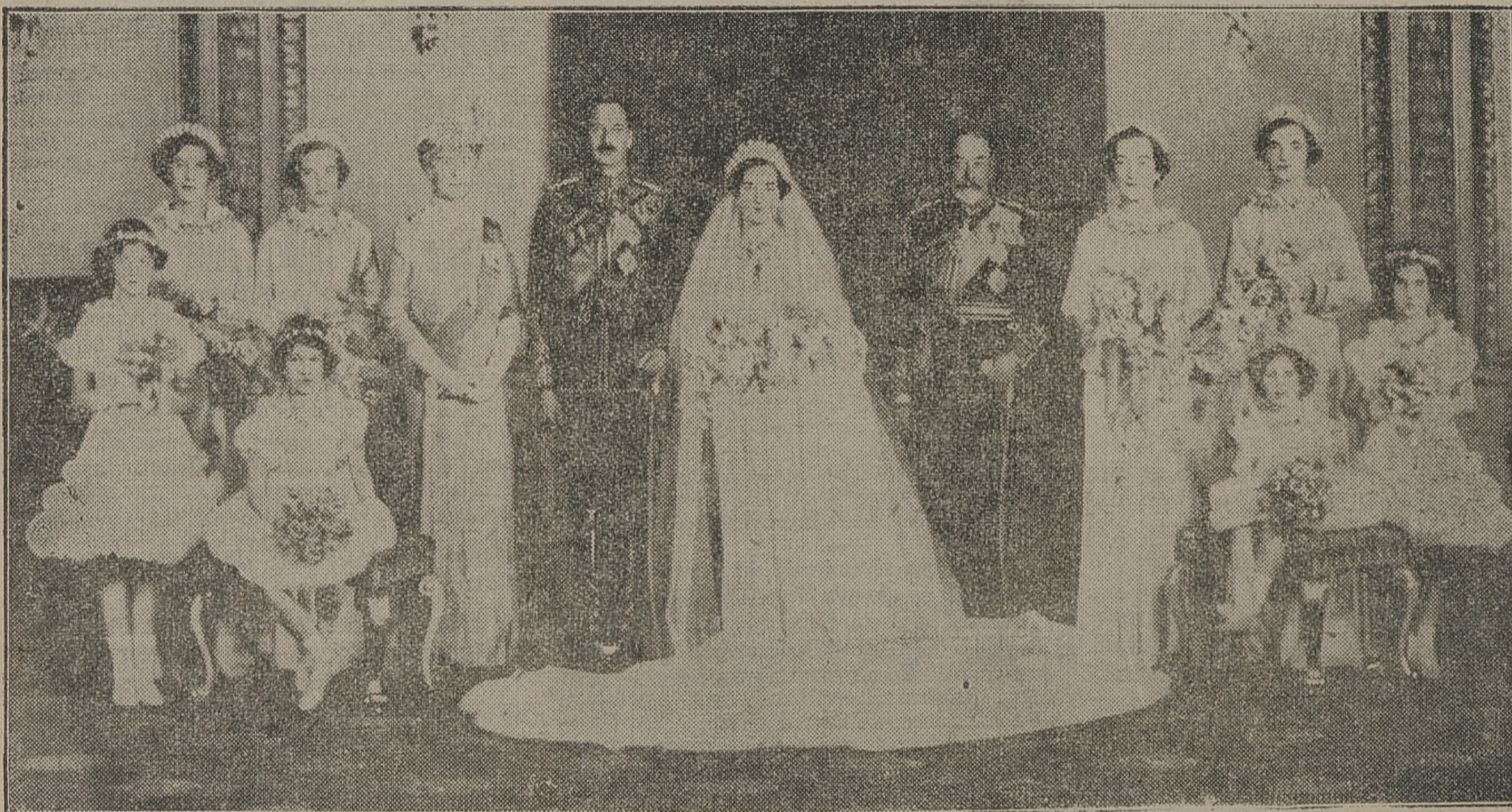
Po obrzędzie zaślubin młodej pary księżcej Gloucester dokonano pamiątkowego zdjęcia w otoczeniu angielskiej pary królewskiej i księżnych dworu.

W pozostałych rolach: INA BENITA, FRANCISZEK BRODNIEWICZ, MICHAŁ ZNICZ