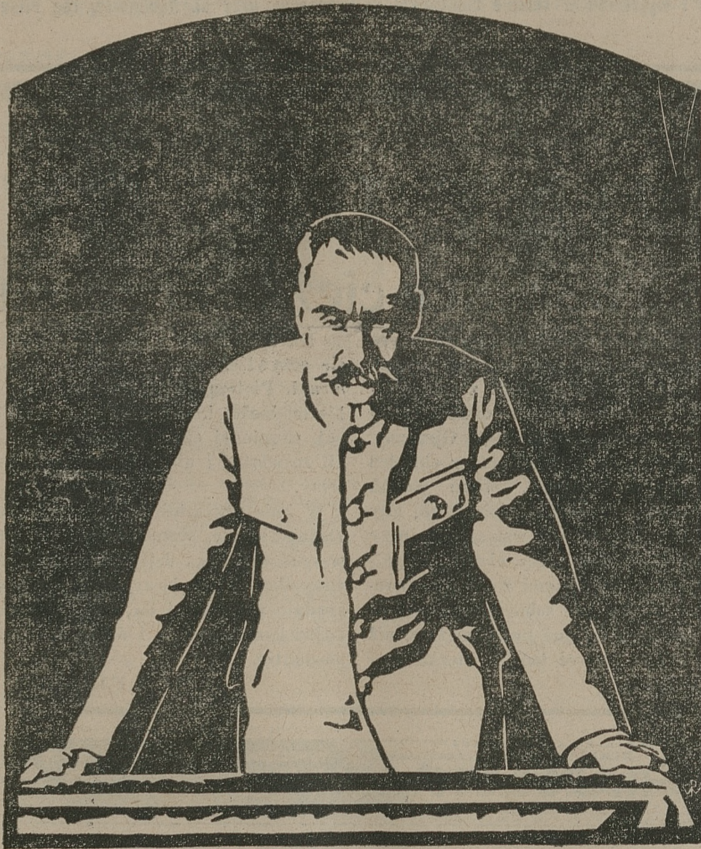
LINORYT WACŁAWA PIŁECKIEGO.