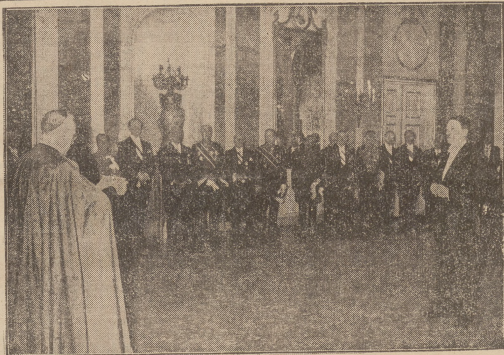
W czasie składania życzeń noworocznych kanclerz Hitler zwrócił się do przedstawicieli świata dyplomatycznego, którzy przybyli do „domu prezydenta Rzeszy” z apelem pokojowym. Zdjęcie nasze przedstawia moment składania życzeń Hitlerowi.

Togal Grypa, przeziębienie, reumatyzm, artretyzm, podagra są zimną plagą ludzkości. Przeciw tym dolegliwościom stosuje się Tabletki Togal. CENA ZŁ. 450 PRZYNOŚI ULGĘ CIERPIĄCYM