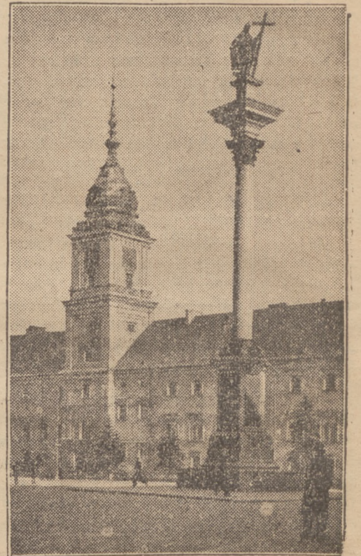
Kolumna Zygmunta w Warszawie.

Sąd na uspokojenie nerwów przepisał panu F. receptę w postaci wyroku, skazującego na trzydzień aresztu.