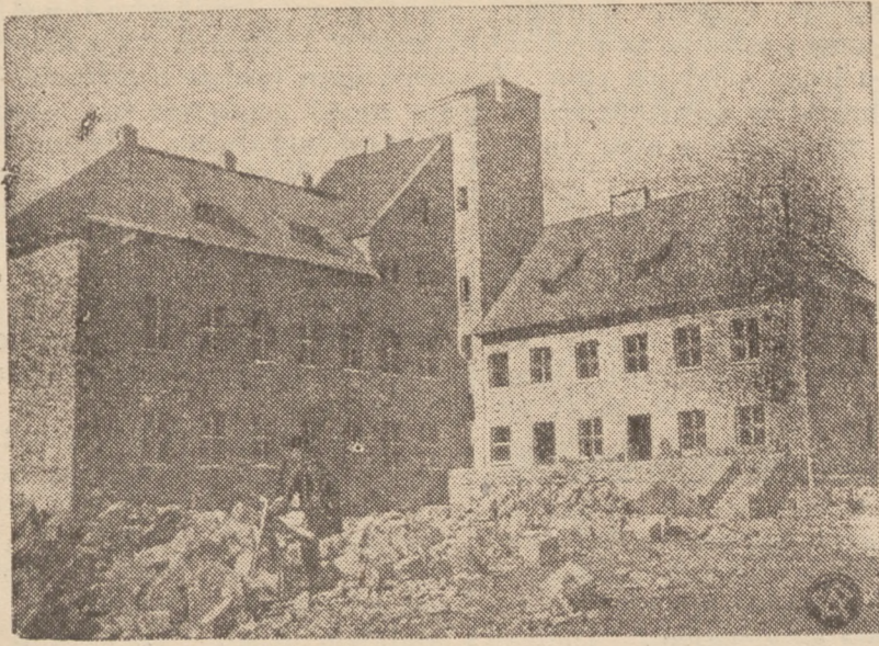
MUZEUM HUCULSKIE W ZABIEM

Reprodukujemy fragment powstającego w Zabielem muzeum huculskiego. Na zdjęciu część schroniskowa muzeum, już wykończona.