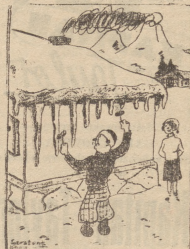
Ksylofonista na zimowych wyprawach.