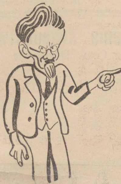
Kalinin w karykaturze

Na łącznym posiedzeniu rady związku i rady narodowej dokonano wyboru prezydium najwyższej rady ZSRR.