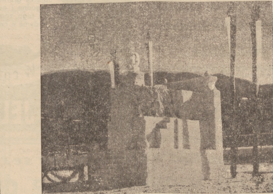
Pomnik Marszałka Józefa Piłsudskiego w Worochcie, wykonany z lodu i śniegu, przy którym zostały