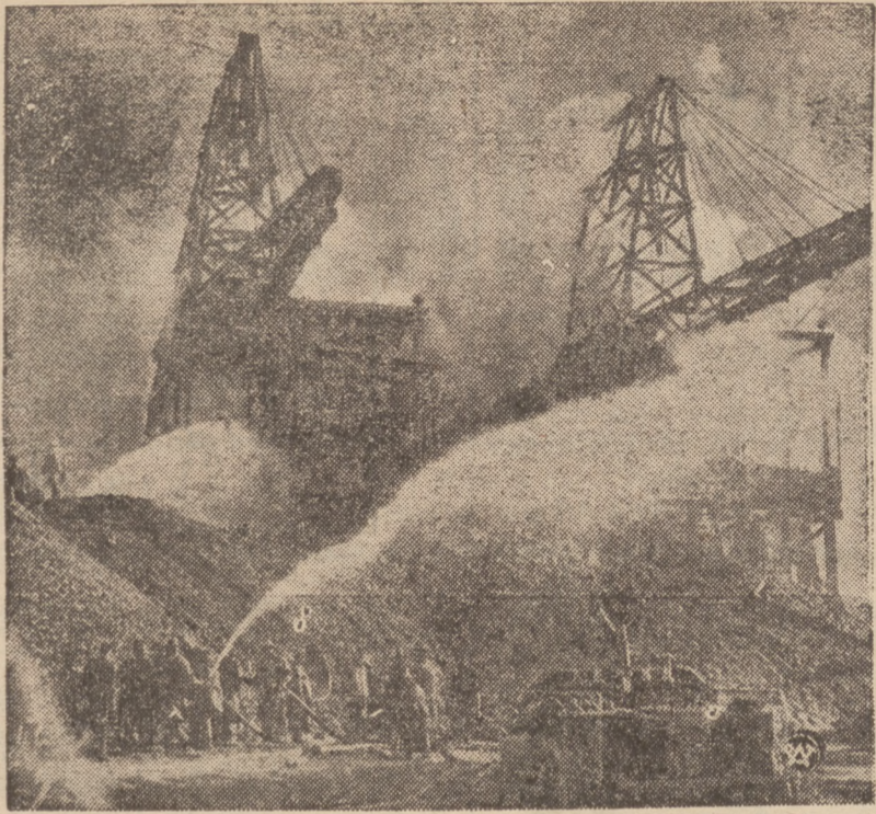
WIELKI POŻAR W AMERYKAŃSKIEJ KOPALNI WĘGLA. (W największych w Ameryce złożach węgla w Massachusetts wybuch niezwykle groźny pożar, powodując okolo milionów zł. strat. Na zdjęciu rzut oka na ten niezwykle pożar w kopalni węgla.)