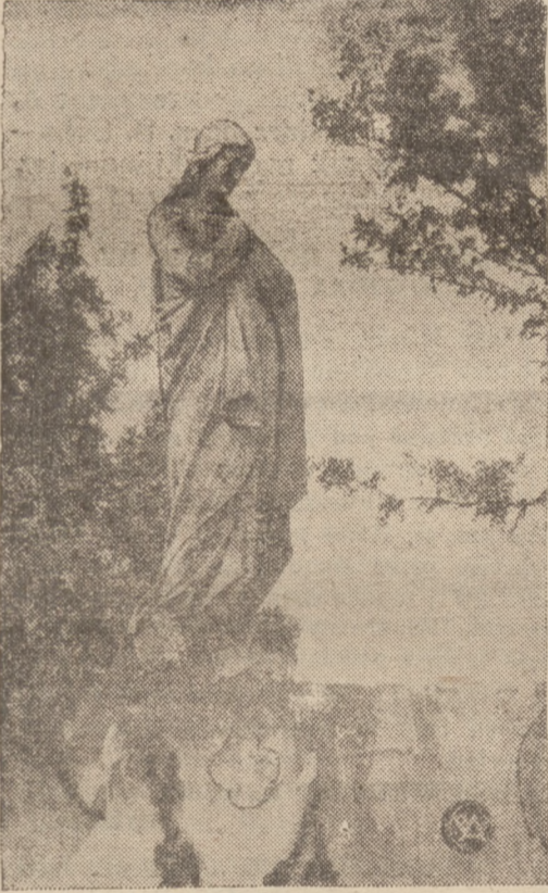
CUDOWNA FIGURA MATKI BOSKIEJ

W Brukseli 12. 6. Niezwykle silne trzęsienie ziemi nawiedziło całą niemal Europę Zachodnią. Szczególnie silne wstrząsy podziemne dały się odczuć w Brukseli. Kilka set osób odniosło cięższe lub lżejsze rany. Są również zabici. Szpitale są obleżone. Ludność groźnie odprawia modły w kościołach, jak i kiedykolwiek nawiedziło Belgię. Wiadomości o trzęsieniu ziemi nadchodzą nie tylko z całej Belgii, ale także z Francji i Anglii. Silne wstrząsy zanotowały obserwatoria francuskie od Dunkierni do Cambrai. Wtrzą- sy odczuły również w samym Paryżu. W Anglii szczególnie silne wstrząsy odczuły w Londynie. Na przedmieściu Woolwich samochody stojące przed arsenałem odzrucone zostały w kierunku chodnika. Na mieszkańcach Londynu niespodziewane wstrząsy zrobiły b. silne wrażenie. Obserwatorium sejsmologiczne w Bromwich stwierdziło, że ognisko trzęsienia ziemi znajdowało się w odległości 340 km. od Londynu. Nie jest wykluczone, iż znajdowało się ono na dnie Atlantyku, promieniując ku wybrzeżom Belgii, Francji i Anglii.