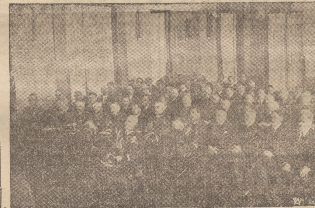
Na zdjęciu — rzut oka na salę obrad podczas inauguracji walnego zjazdu delegatów Związku Legionistów Polskich, w kasynie Garnizonowym w dniu 25 czerwca. Za Panem Marszałkiem siedzą: pan Premier

Na zakończenie zjazdu dokonano wyborów do władz naczelnych związku oraz wysłano depesze hołdownicze do p. Marszałkowej Piłsudskiej i płk. Adama Koca.