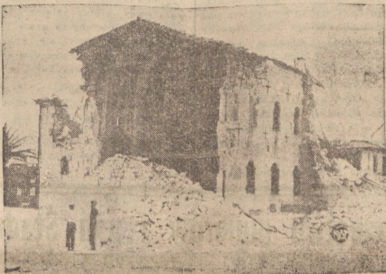
Przed paru dniami w Grecji miało miejsce trzęsienie ziemi, które wyrządziło szereg spustoszeń, w prowincji Attika. Na zdjęciu — zniszczony kościół w Oropos.

Zwłoki obywateli polskich, którzy padli ofiarą katastrofy, zostaną przewiezione do Polski.