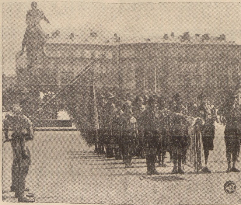
HARCERZE POLSCY Z FRANCJI W WARSZAWIE.