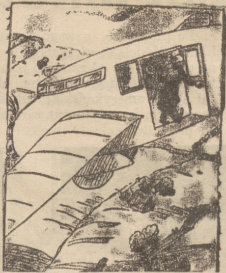
— Proszę spokojnie dalej jechać — zaraz wracam!