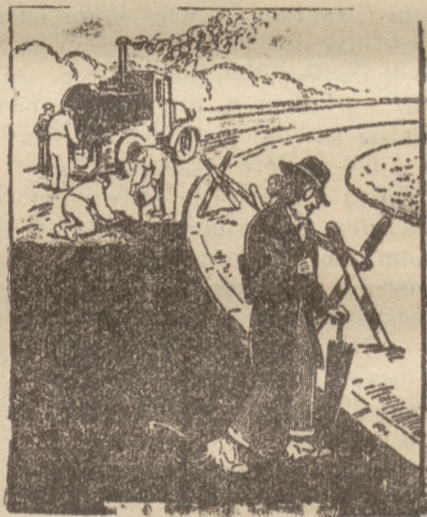
Dziwne, że tak ciężko dzisiaj chodzić