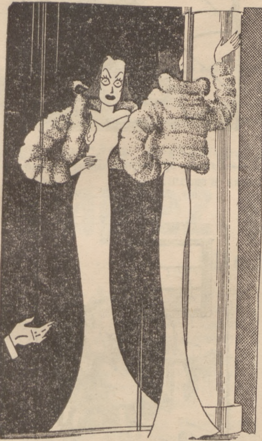
JOAN CRAWFORD W KARYKATURZE

Po premierze nowego swego filmu „Modelka“ otrzymała słynną gwiazdą list od znanego literata amerykańskiego. List ten ukazał się w amerykańskiej prasie, przy czym nazwisko autora zostało przemilczane.