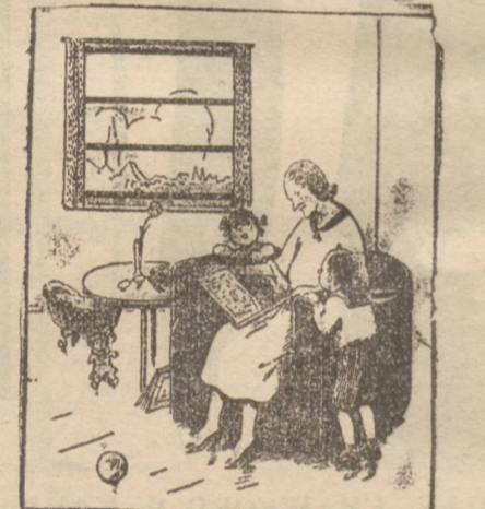
— A cobyś ty zrobił, Pawełku, gdybyś dostał zabawkę „Stolku nakryj się?”