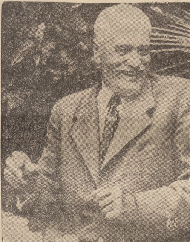
OSTATNIE ZDJĘCIE PANA PREZYDENTA RZECZYPOSPOLITEJ PROFESORA DOKTORA IGNACEGO MOŚCICKIEGO Z LAURANY W ITALII. —

Tak to — na pierwszym piętrze hotelu „Aleron” — w pokojach 104—107 rozstrzyga się niejako historia pokoju czy wojny.