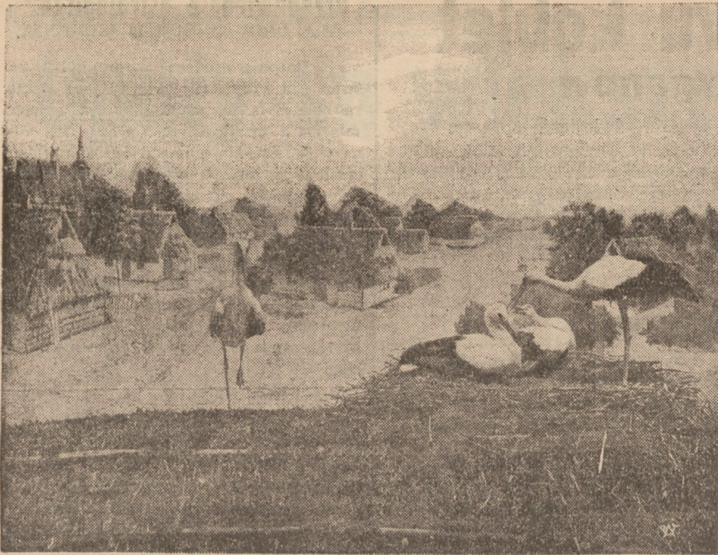
MOTYW ZE WSI POLSKIEJ.

Muzeum Historii Naturalnej w Chicago założyło ostatnio nowy dział muzealny poświęcony życiu bocianów. W dziale tym został zawieszony duży obraz, zatytułowany „Bociany w polskiej wsi”. Obraz ten reprodukuje.