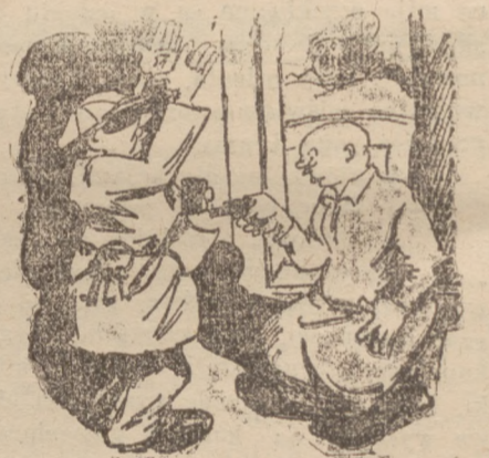
— Pawle — przecież tam nie ma naboń!

— Przecież powiedziałeś mi już raz przed miesiącem, że długu oddać nie możesz. — No, widzisz, że dotrzymuję słowa!