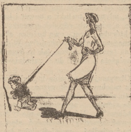
Omyłka młodej matki.

daj drobne ogłoszenie w „Expresie Zagłębia”, a odniesiesz skutek niezawodny.