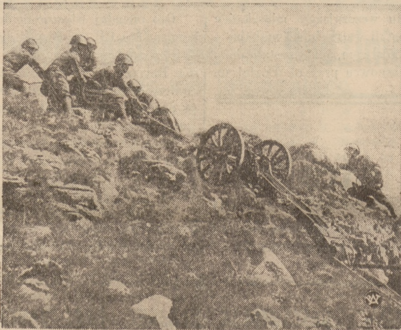
WOJSKA NA MANEWRACH

Na zdjęciu ćwiczenia górskiej artylerii c. eskiej.