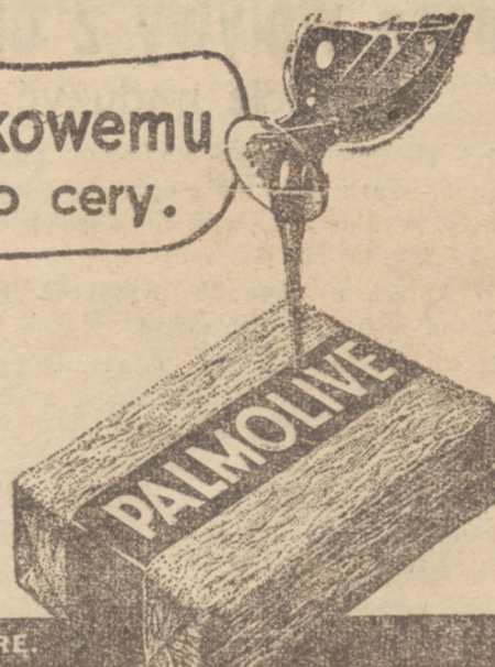
SHAMPOO PALMOLIVE PIELĘGNOJE WŁOSY JAK MYDŁO PALMOLIVE CERE

Przed stosowaniem zabiegu olejkiem oliwkowym, wyglądałam na 45 lat! Olejki oliwkowemu zawdzięczam „wytorność cery” i wygląd o 10 lat młodszy! Jednomiesięczne używanie mydła Palmolive na oleju oliwkowym sprawiło ten cud. Olejek oliwkowy jest bezsprzecznie najskuteczniejszym naturalnym środkiem dla udelikatnienia, upiększenia i odmłodzenia skóry. Spróbuj! Przy kupnie strzeż się naśladownictw i żądaj tylko mydła Palmolive.