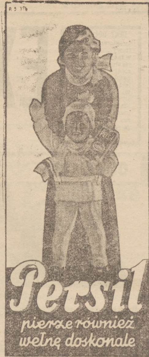
Wyrób Polskiej Spółki Akcyjnej „Persil” w Bydgoszczy

Audyencja trwała około 1 i pół godziny, w czasie której Pan Prezydent wypowiedział Swoje zdanie i uwagi na temat poprzednio przedstawionego Mu me-