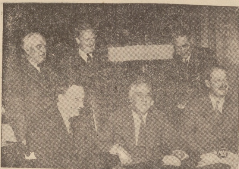
Na zdjęciu—Prezydent Stanów Zjednoczonych Ameryki Północnych Roosevelt w otoczeniu liderów partii demokratycznej stanu Pensylwania, po wielkim meetingu przedwyborczym, urządzonym przez partię demokratyczną.

Zbiórka na odnowienie Kościoła W. N. M. Panny w dniu 15.XI odbędzie się od godz. 15 ul. Aleja Mireckiego, środa dnia 16.XI od godz. 15 Domy Dietlowskie przy ulicy 3-go Maja i Wawelu, czwartek, dnia 17.XI od godz. 10.30 rano ul. Pańska, Ostrogórska i Biała, piątek, dnia 18.XI od godz. 10.30 ul. Wiejska, sobota, dnia 19.XI od godz. 10.30 ul. Małachowskiego, 1-go Maja i Domy Schönowskie.